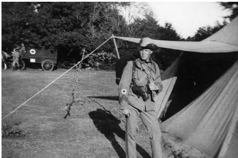
Sommarövningar i Mölleröd, korpral Joëlson i m/10.

lades i en gryta hel och hållen och koktes till mos, och en slev ur grytan kunde innehålla diverse delar av torsken. En lunchrätt som inte heller hörde till de mest uppskattade var en ordentlig bit saltad islandssill och gröna ärter. Torsdagar var det fest, då serverades ärtsoppa med fläsktärningar och pannkaka med sylt.