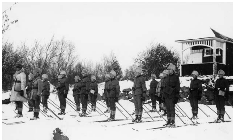
Sjukvårdsfurirskolan under uppställning framför "Villa Caloric" på lägerplatsen i Mölleröd.

Men åren släppte skotträdsplan och jag blev pistolskytt.