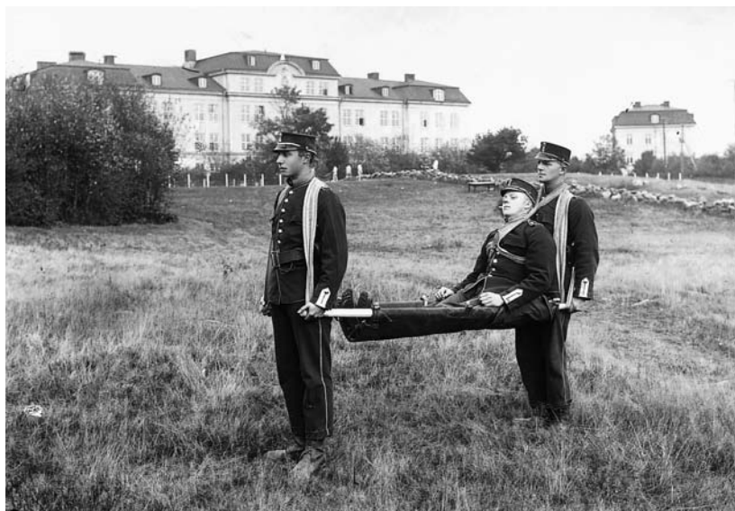
Sjukvårdsutbildning på 1920-talet. Övning med sjukbår m/87 på området söder om kasernen.

Ett bårslag skulle bestå av fyra man så att de kunde avlösa varandra som bärare. Nu var vi bara tre, så det blev jobbigare än det borde vara. Och så skulle vi ha en sårmarkör att kånka på, så egentligen borde vi vara fem. Men sergeanten visste på råd. Med en jutesäck och en spade och grus från ridbanan gjorde vi en sårmarkör. Den vägdes i maskinist Skoglunds källare och befanns vara för lätt, varför vi fick fylla i ytterligare ett par spadtag grus. Sen var vi redo att börja bära bårar. För att om möjligt minska den sårades lidande skulle man gå i bårtakt. Det betydde otakt, men inte vilken otakt som helst. Man skulle gå som en passgångare – på två steg skulle man göra fyra fotnedsättningar. Somliga har svårt för att gå i takt, men det är betydligt svårare att gå i bårtakt. Vägen runt kaserngården var 510 m och där bar vi några varv dagligen. Ett våldsamt regn gjorde vår sårmarkör några kilo tyngre och sen frös