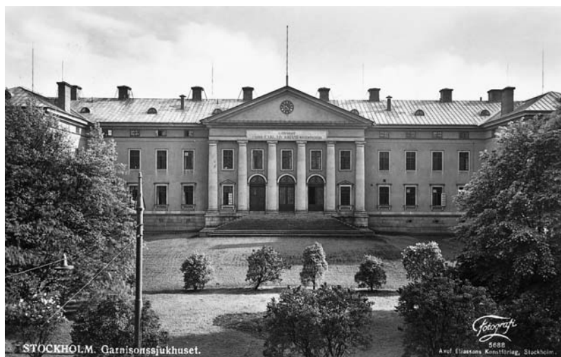
Gamla Garnis i Stockholm.

På försommaren ryckte årets värnpliktiga in och både kasernen och terrängen fylldes av folk. Vi volontärer slapp våra blå uniformer och