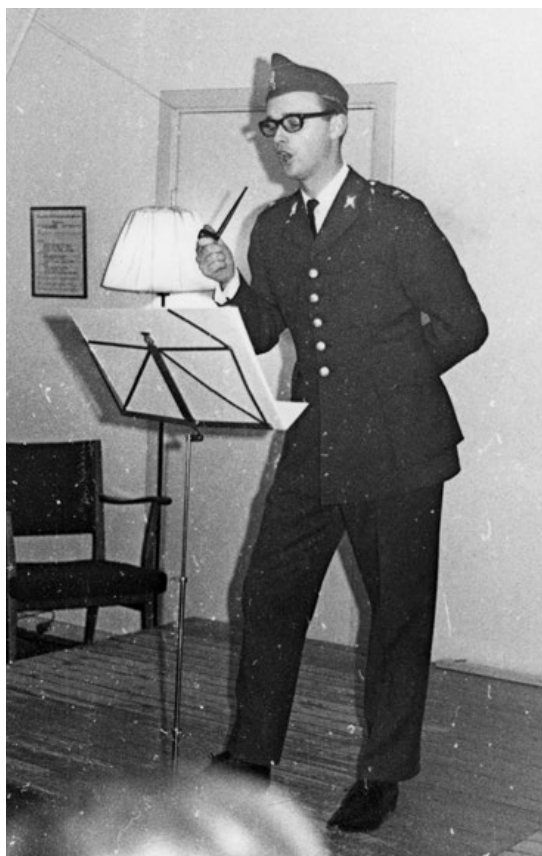
Vem är vem och föreställer vem?