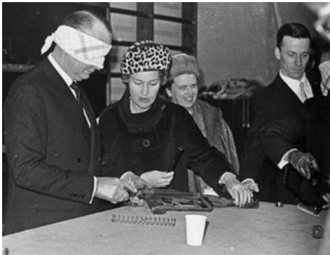
Vapenkunskap på hög nivå.

Under 50-70-talen disponerade de tre befälskårerna var sin mässlokal. Regoff kåren 3.e våningen i kanslihuset, uoff kåren 2. våningen i sjukhusbyggnaden och ubefkåren i marketenteribygnaden. I de olika lokalerna fanns möjlighet för resp kår att ordna mathållning. I regoffmässen serverades frukost, lunch och middag som regel alla vardagar. Under de stora repetitionsövningarna vår och höst kunde dagligen serveras 120 luncher och halva antalet frukostar och middagar från ett kök, som var dementionerat för 12 personer. Mässlokaler användes också för de olika kårernas fester och sammankomster. På regoffmässen anordnades ofta middagar med dans till levande musik. Gåsammiddagen var regoffkårens årliga högtidsmiddag med inbjudna gäster och avtackning av pensionärer. Som alltid vid regementenas högtidsmiddagar var klädseln stor högtidsdräkt och middagen inleddes med kungssången.