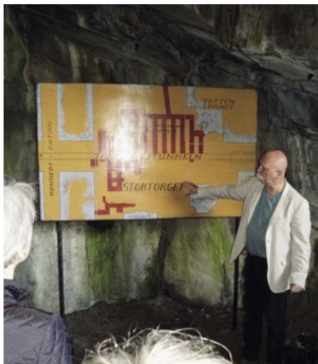
Skiss i underjorden