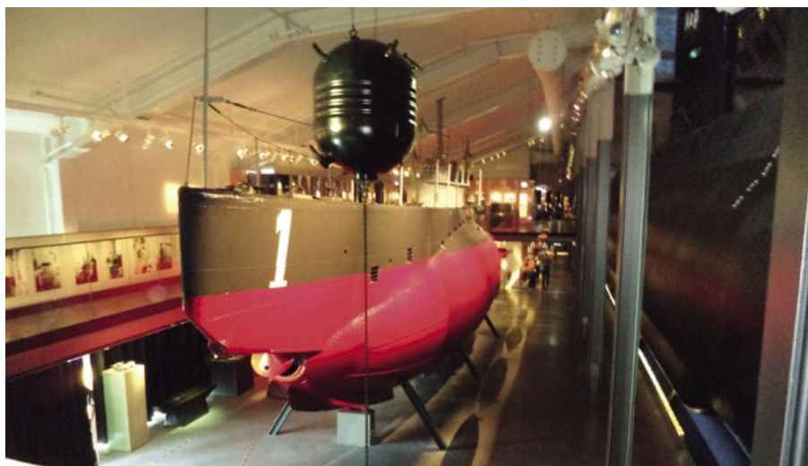
Hajen, Sveriges första ubåt