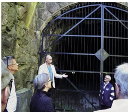
Järnvägstunnel under Karlskrona