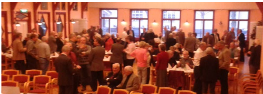
Samling före årsmötet