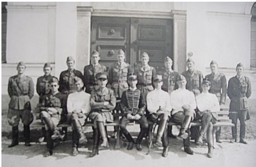
Ridskolan 1946-47 på Strömsholm, 10 månader underbefälskurs.

Gösta blev sedan orolig då man i området började göra övningsplats och gräva värn, men tydligen klarade sig graven.