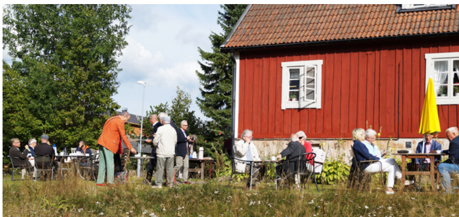
Fika på Verumsgården