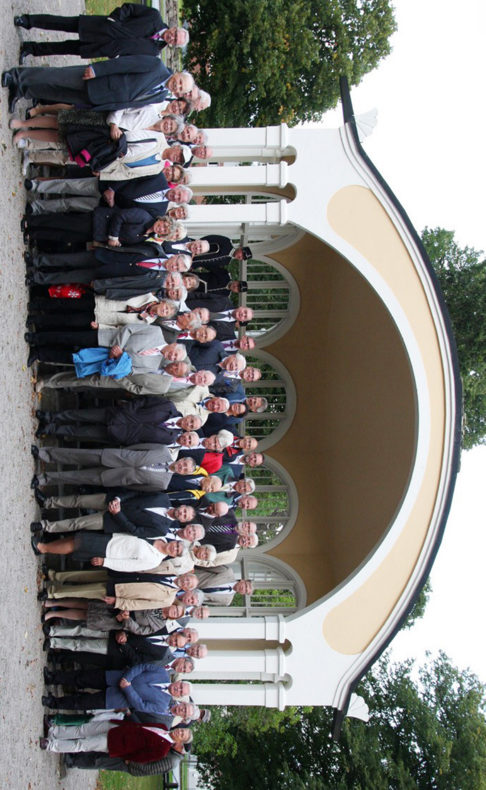
Alla deltagarna vid trängträffen 2015