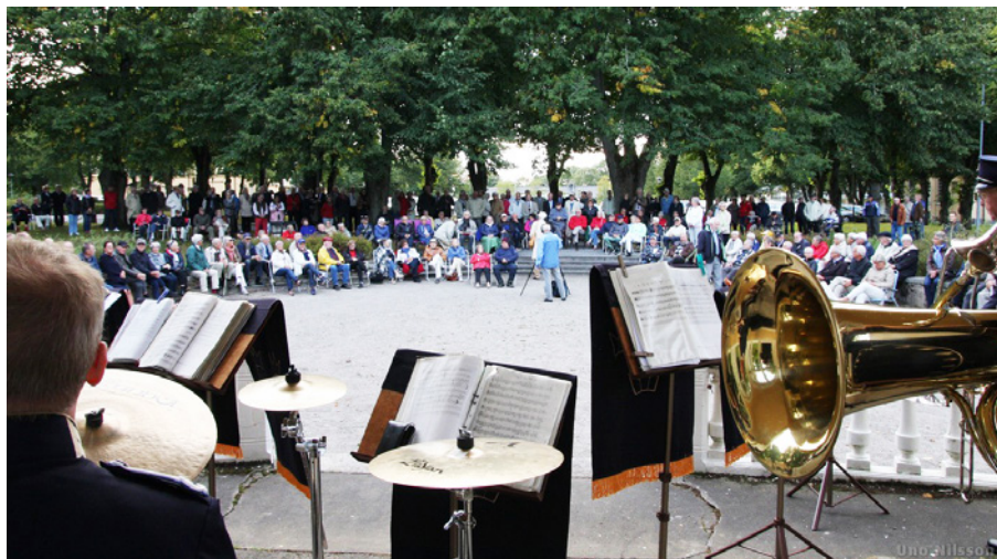
Det var populära spelningar