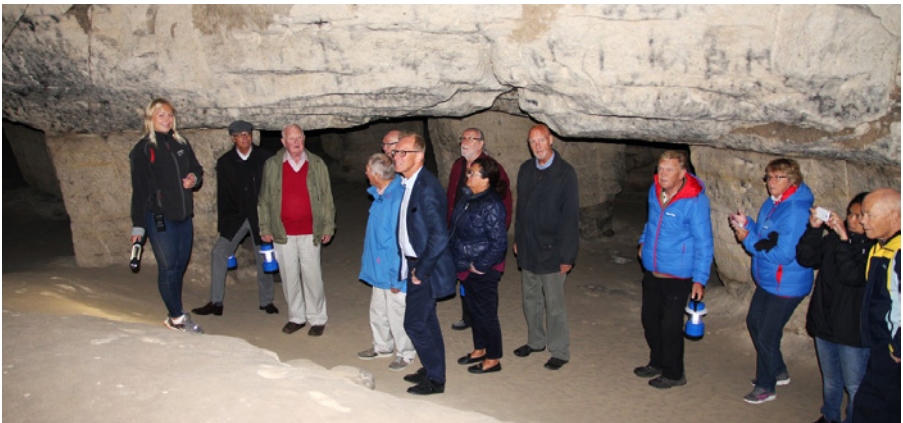
Under jord i Tykarpsgrötan