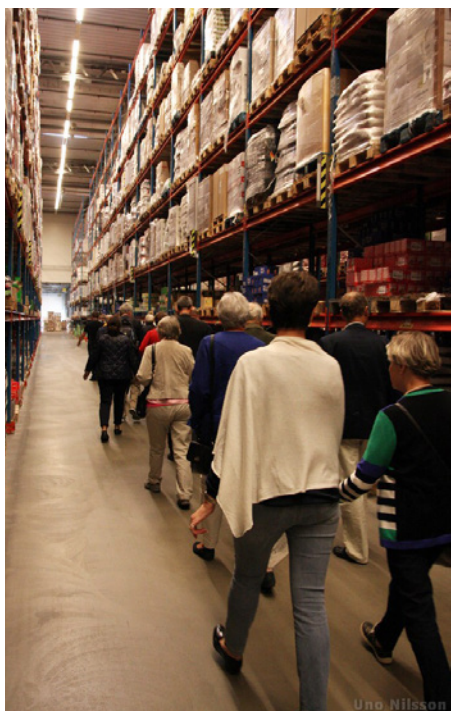
Bild från lagret