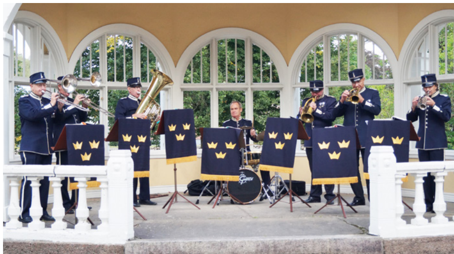
Brunssexetten i T4 uniform m/Ä