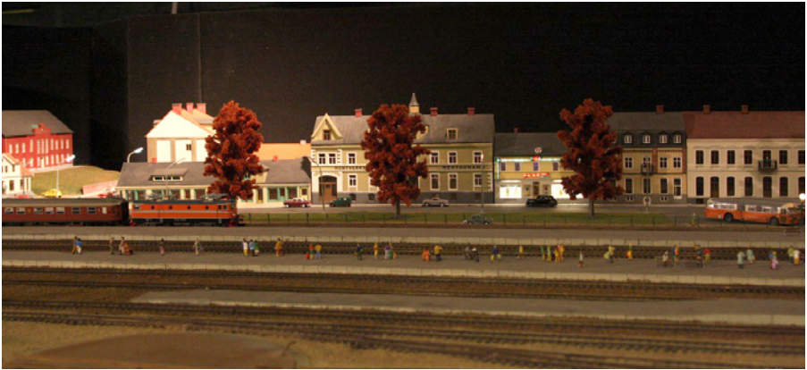
Järnvägsgatan i Hässleholm skala 1:87