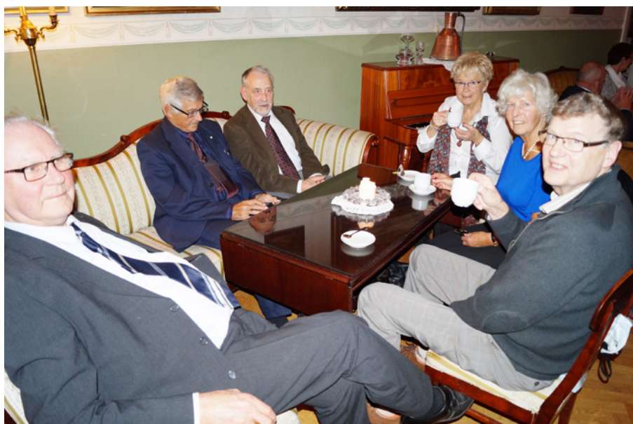
Arne Huléen har varit fotograf.