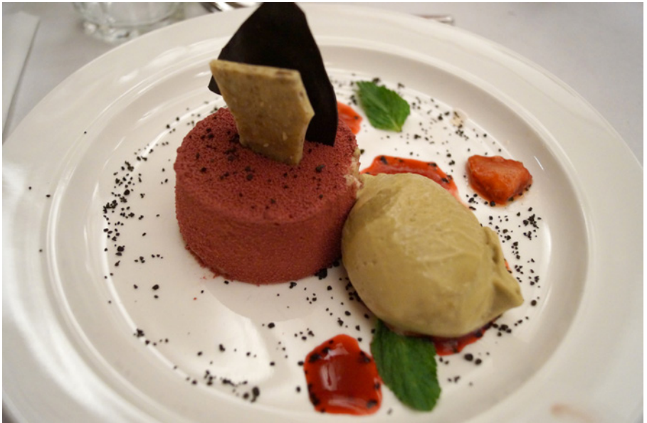
Deserten var elegant och smakfull.