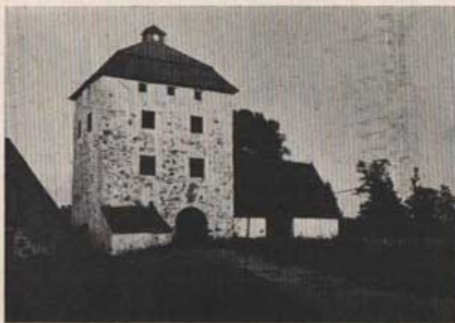
Porttornet på Hovdala.

ning av borgområdet skulle otvivelaktigt ge värdefulla resultat, och i varje fall borde platsen sättas i värdigt skick.