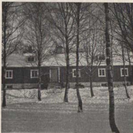
Fritidsgården — Din egen gård.