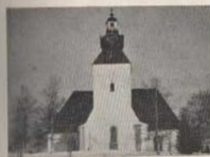
Kyrkan, sedd från älven.

Själva samhället Malung har ett mycket naturskönt läge i Västerdalälvens dalgång och är omgivet av åsar och bergsryggar av ända upp till 600 meters höjd. Bebyggelsen är spridd över en mycket stor yta och är endast på två ställen koncentrerad, nämligen kring den i funkisstil nyigen uppförda järnvägsstationen, som även inrymmer post- och telegrafkontor samt kring den delvis medeltida i gråsten uppförda kyrkan, som majestätiskt reser sig över de vita vidderna. Den medeltida huvudbyggnaden var under 1600-talet föremål för utvidgning och försägs år 1757 med korsarmar, vilket är även det nuvarande koret byggdes. Tornet ändrades år 1828, och försägs då även med s. k. lanternin, till vilken man kan taga sig upp genom en smal vinkeltrappa. Härifrån erhålles vid klart väder en underbar utsikt över ett i solljus badande vinterlandskap. At nordväst kan ögat följa den frusna Västerdalälvens vindingar ända upp mot Lima och Transtrand, och mot den blå himlen avteckna sig vid horisonten skarpt konturerna av de snöklädda Hemfjällen och Hundfjällen, båda ut-