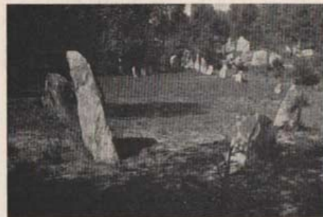
En av Vätterydsfältets ståtliga skeppssättningar.

Söder om Sösdala municipalsamhället påträffas vid vägen mot Tjörnarp en av södra Sveriges förnämsta stensättningar, Vätterydsfältet, även kallat Stenskog. Under järnåldern synes Göingebygden ha haft en verklig storhetstid, och här, särskilt i Hässeholmstrakten, finna vi Skånes främsta järnåldersminnen. Vätterydsfältet, som i början av 1800-talet skall ha räknat omkring 600 stenar men nu har "bara" 230, är denna landsändas största samling av skeppssättningar, efter restaurering ett 15-tal tydliga skepp, av vilka det största är 24 meter långt och består av 25 stenar. Granskar man gärdsgårdarna i närheten, konstaterar man lätt nog, vart åtminstone en del av stenarna tagit vägen. Sägner förmåler om ett forntida slag: "På Jettery, Vettery ständar ett gny, när slaget står mellan Gunnarp och Medelby" (Medelby = Mellby). — Fram till Tjörnarp stationssamhälle är 3 km., där