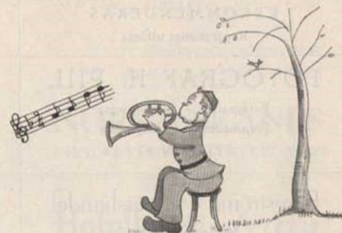
Konsert i Stadsparken.