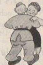
Drömmarnas vals på Björksäter.