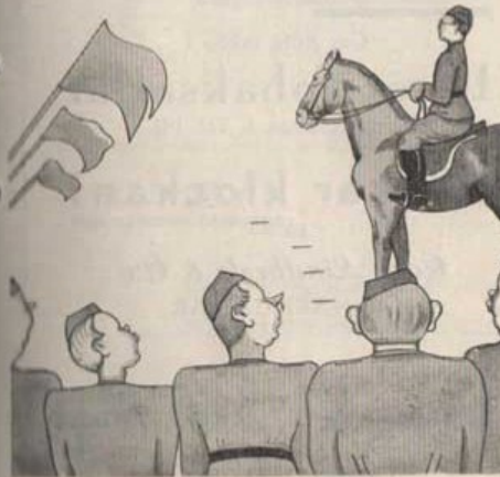
Högtidlighet på Stortorget.