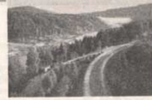
Förbi Angermanälven vid Forsmo gick färdan.

delade vi det emellan oss så gott det gick. Det var ju inte så mycket, men det var ju alltid något.