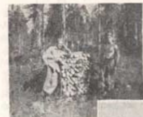
Ett par av "hug-garna" med en del av resultatet.

En sak bekymrade oss särskilt, och det var att vi inte fått ut våra penningtillgodohavanden för huggningen, och till råga på allt var det Barnens dag på lördagen och söndagen. De av oss som hade något på postsparbanken tog ut det, och sedan