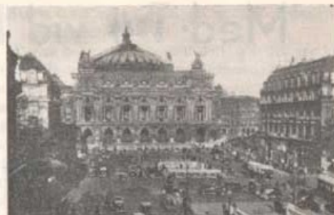
Place de l'Opéra.

För att ingen av dessa bilder från Montmartre skall förledas att tro, att nöjeslivet där är bely-sande för moralen i Frankrike, förtjänar det på-pekas, att det finns få länder, där flickorna äro så strängt hållna som i Frankrike. Mellan "glädje-