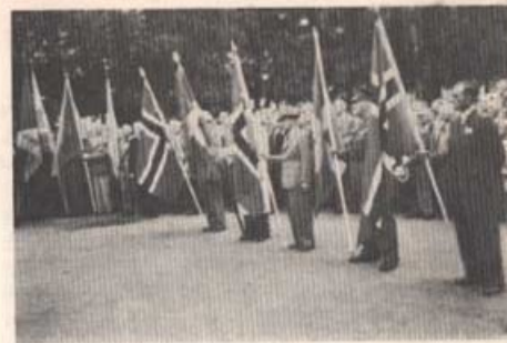
Nationsflaggor och soldatföreningsfanor vid hälsningsceremonien.

Efter högtidligheten ställdes färden i militärbilar till Hvalsmoen, en sex mils bilfärd i den norska naturen med den mest hänförande utsikt över de snöbelagda fjällerna. De å Hvalsmoen förlagda ingenjörtrupperna demonstrerade bl. a. den från kriget så kän-