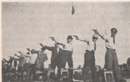
Mästerskapskjutningen har börjat. Tredje man från höger är Torsten Ullman, slutlig segrare i klass B.

Ett stort skytteevenemang ägde rum här vid kåren under sensommaren, då T 4 pistolskytteklubb hade fått äran att arrangera Sydsvenska mästerskapen på pistol, en uppgift som klubben skilde sig från med stor heder. Detta betygades också av tävlingens namnkunnigaste deltagare, olympiamedaljören och mångårige mästerskytten Torsten Ullman.