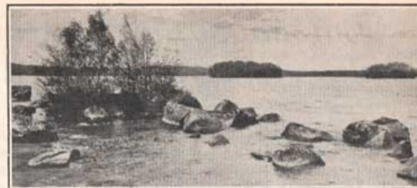
Motiv från Luhrsjön.

Terrängen mellan Luhrsjön och Tydingen har varit en av medelpunkterna för de skånska krigshändelser-