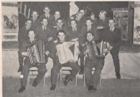
De glada medverkande i 6. komp. kompaniafton.

Kompaniafton! Då släpps gäcken lös och man roar sig och varandra efter bästa förmåga. Mindre episoder från gemensamma övningar dras fram och berättas av kompaniets lustigkurrar. Typiska drag hos befälet gisslas och imitatorer och skådespelarembryon