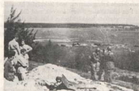
Förberedelser för skjutning med 37 mm akan.

Larsson fick föra plutonen ner till ett vägshål, vars vänstra förgrening ledde till Önnestad, och den högra, den Larsson svängde in på, mot Backeboda och därifrån till Sönerlycke.