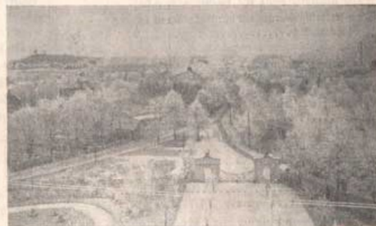
HESSEHOLM. Förrådsområdet. Huvudförrådet, sett från kanslihuset. Till vänster synas underofficersbostäderna.