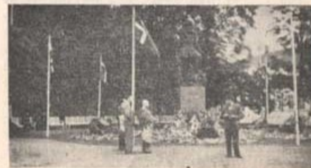
"Den tapre Landssoldat"