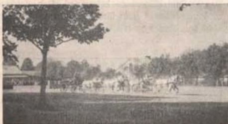
Ett åttaspann med fanj Bergström på kuskbocken.