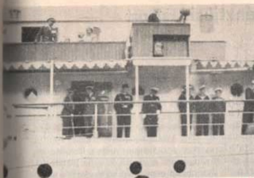
Dannebrogen med den danska kungafamiljen.

Därefter skedde kransnedläggning vid Landssoldatens staty av de nordiska ländernas soldatföreningar. För Sverige nedlades kransen av överste