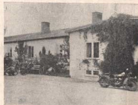
Ökenfortet i Kristianstad. (4. komp)