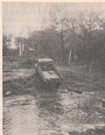
Terränggående lastbil tar sig över Almaån.