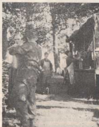
Bestyr på kokplatsen.