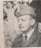
Kasernuoff Fanjunkare C. Bilbo