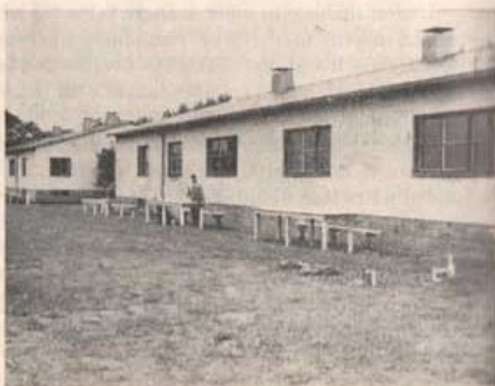
Förläggingsbaracker i Revingehed. (5. komp)