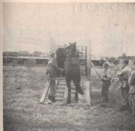
Ilastning av hästar för landsvägstransport