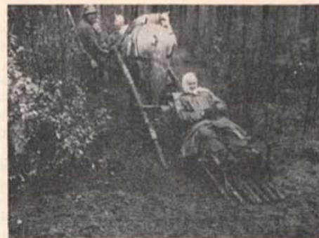
Släporna ta sig fram överallt.