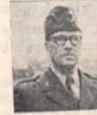
Furageuppbman Fanjunkare R. Hjelm