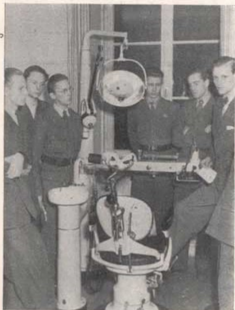
Känns stolen igen?

Kl. 15.00 samlades de gräklädda på marmor-