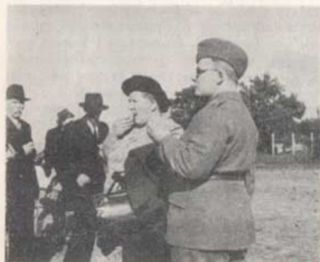
Fältbageriets wienerbröd smaka bra.

När man gått och tittat på allt detta under en timmes tid, drog man sig så småningom upp till ridplan för att åse den traditionella rytтарыppvisningen, en av de allra sista, då hästarna i början