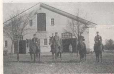
Det var en gång...

Utbildningen omfattade första vintern sex timmars balansridning i veckan. Däri ingick även hoppträning inomhus eller i hindergård. Som regel blev det hindergården, när hästarna efter en särskilt "givande" lektion var riktigt vitlöddriga och hala som en såpad stång. Då togos sadlarna av, och sedan blev det full fart på både häst och ryttare men oftast åt olika håll. Det var en härlig avkoppling och lärarens dåliga humör blåste bort direkt.