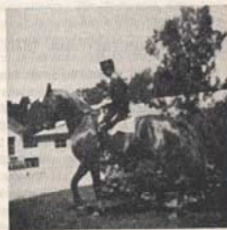
Fanjunkare Liedholm — Peve ✓