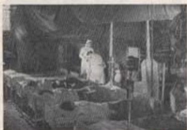
Filmkamera och ljusprojektörer i världstältet.

Sjukvårdstjänsten vid infanteribrigad filmas vid T4.