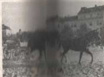
Fanj Lindén ✓