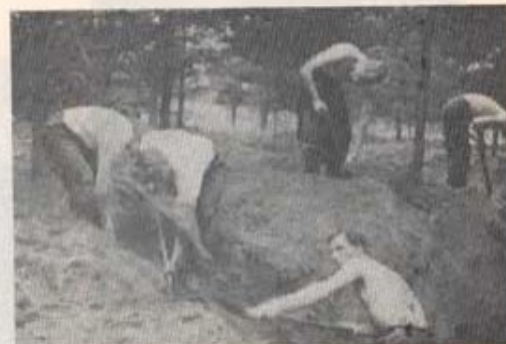
Grävning av fältbefästningar.

juni. Han hoppades att den glada och skämtsamma — ibland gränsande till burleska — stämning, som hela tiden hade rått under inspelningen skulle fortsätta hela inspelningen under den motiveringen, att detta var säkraste tecknet till att filmen i färdigt skick skulle bli mycket realistisk, då just ko-