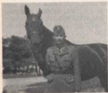
P. W. — Peve ✓