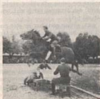
Kapten Falk — Arab ✓