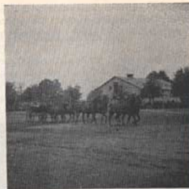
Sexspann — fanj Bergström