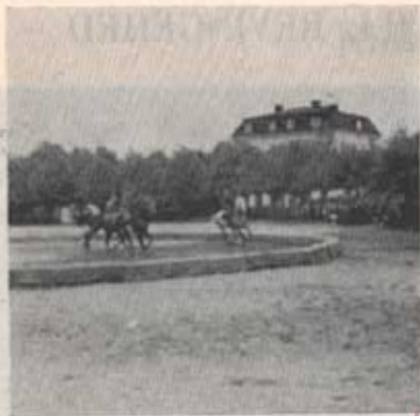
Jeu de rose ✓