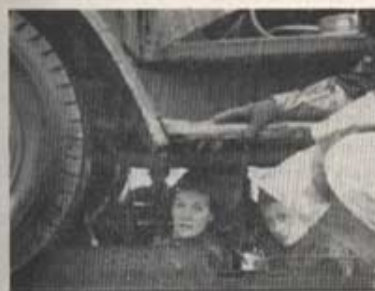
Instruktion i rundsmörjning.

som bilförare i någon stad eller i civilförsvaret vara förare av ambulans, annat utryckningsfordon eller fordon, som används under utrymning av en