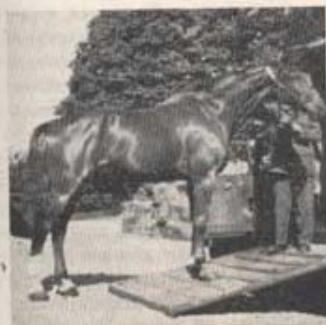
Rip muckar ✓