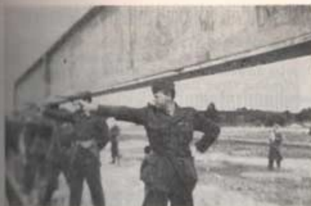
Från precisionsskjutningen på korthållsbanan. Regementschefen närmast.

På de två första stationerna sköts precisionsserier om vardera sex skott på tre minuter och 30