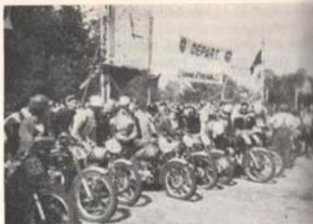
En bild från startplatsen i Ostmalle.

Under själva tävlingen fick man lära sig en hel del utländskt nytt. Vad själva starten beträffar, så är man van vid att en starter flaggar iväg fältet. Här stack de tävlande iväg så fort starterna över huvud taget visade sig. Alla körde, utom en — en av paragraf- och reglementsbestämmelser genomsyrad svensk. Ja, där stod man som sagt ensam och allens medan de övriga försvann bakom ett tjockt dammoln. Så småningom kom man dock på det klara med att här var det bara att åka. I detta första heat blev starten dålig men efter en stund var plats nr 6 bland de 13 startande i blågul favör. När endast ett varv återstod var en trädrot i vägen och slet av bromsen, varför det sista