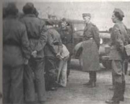
Militärbefälhavaren, generalmajor Akerhjelm inspekterar SKBR-kursen. ✓

Under ett par veckor i våras hade på militärbefälhavarens order anordnats en kurs för elever av SKBR (Sveriges Kvinnliga Bilkärs Riksförbund). Kursen hade samlat ett trettioåttal elever från Västervik i norr till Ystad i söder med yngste deltagare på 19 vårar och äldste på 46.