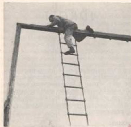
Första hindret på hinderbanan.