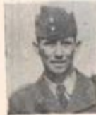
Expuoff Fanjunkare P. Liedholm