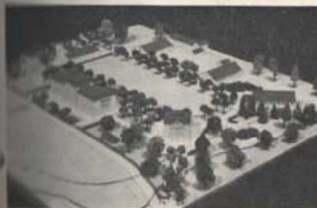
Modell av kasernområdet med byggnader enligt första utbyggnadsplanen.