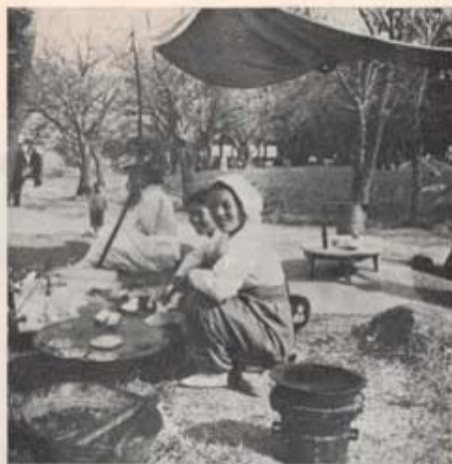
Koreanska kvinnor vid middagsbordet.

frånfronten kom som regel på kvällen vid 2300-tiden till Pusan, där sjuktransportbilar tog hand om dem för fördelning mellan sjukhusen.