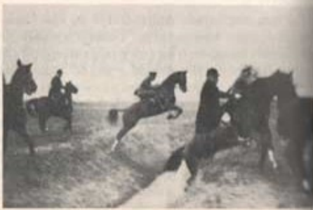
Första hindret med översten i jaktdress närmast.

Jag hade 1930 fått ett resestipendium för fackstudier i Tyskland och bland annat fått tillstånd att ett par veckor tjänstgöra vid 9. kavalleriregementet i Fürstenwalde, en liten älderdömlig stad öster om Berlin, nu i Östzonen. Jag anmälde mig en måndag i oktober, bekantade mig med min kollega, regementsveterinären, något äldre än jag, fick mig tilldelad en stor, elegant häst och promenadred tillsammans med kollegan. Detta var på Riksvärnets tid, då all personal var stamanställd, och man ägnade sig tydligen då på hösten huvudsakligen åt att lägga ut jakter. För att få övning i språket beslöt jag att äta på officeramässen och de unga löjtnanterna där talade som vanligt bara om hästar och ridning. "I morgon rider vi jakt. Ni kommer väl med?" hette det första dagen. Jag hade ju ännu knappt provat hästen och visste inte om svårigheterna, så jag svarade undvikande, att jag ville vänta och se. Kollegan tillfrågades om svårigheterna och han avrådde absolut. Självt red han inte med och det var absolut ingenting för mig heller. Det vore ju förskräckligt, om jag skulle