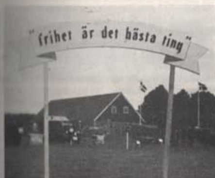
Entrén till försvarsutställningen i Örskelljunga.

Under sommaren har regementet deltagit i inte mindre än tre försvarsutställningar, nämligen i Örskelljunga, Lönsboda och Smedstorp. Av dessa var den i Örskelljunga den ojämförigt största och även den för regementet mest intressanta, bl a av det skälet att den gick helt i T 4:s regi.