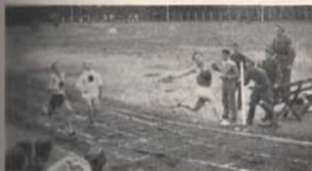
Visa prov på spänst — tag idrottsmärket!

Denna maning har tidigare många gånger stått att läsa i vår tidning. Men frasen blir inte utsletten, varje år är den alltid lika aktuell, och just nu står regementet uppe i idrottsmärkesarbetet. Sedan länge ha vi varit bland de främsta inom distriktet, ja, efter att i fem år överlägset ha blivit bäst, lingo vi i fjol på sluttampen stryk av F 5. Skall vi få stryk i år också? Vi hoppas inte det och kanske är det just Ditt prov som erfordras för att så ej ska bli fallet. Just nu äro cirka 150 prov redovisade, målet är 400. Många äro på väg och det gäller bara att avsluta. De flesta av oss ha i år blivit simborgare. Därmed är ett prov klart och det är bara att fortsätta. Tag ett krafttag i idrottsmärkesarbetet efter ledigheten.