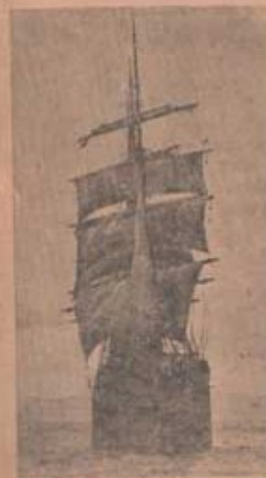
Fartyg ur Nordstatens flotta på väg uppför Dalälven

Krigserfarenheten visar att motståndsviljan ofta först brytes vid de bakre förbanden, trots att dessa i huvudsak äro undandrag- na de omedelbara stridetryck- ken. Motståndet mot upplösning- stendenser är god anda, fast dis- ciplin, ordning, övning och ar- bete.