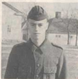
1517—12—51 Nelson, 3. komp

Vid ålderklassens uttryckning i mars fingo ovanstående värnpliktiga av regementchefen mottaga kamratföreningens hederspris till främste soldat under utbildningsåret 1953—1954.