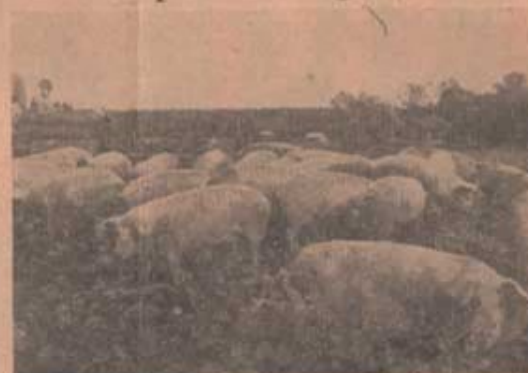
Svin utanför slakteriet i väntan på slakt

Vår presskollega Aftonbladet har låtit meddela sin häskräta, att manöverdelagarna sammantagna korvkonsumtion skulle uppgå till 15 km, som alltså skulle genomätas. Vid specialintervju med högsta charkuteriledningen i Sydstatens armé har emellertid framgått, att enbart i Sydstaten ligger produktionen på 12 km (om korvens längd beräknas till i genomnitt för samtliga korvsorter 40 cm).