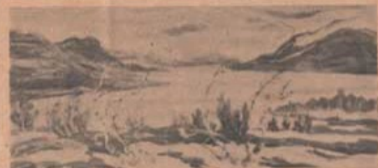
Natursceneri från Nordstaten (Erik Oshund)

Man upplyser också, att endera dagen kommer 3600 wienerbröd att bakas till extra förplägna.