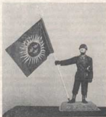
Miniatyr av fanförare med regementets fana. Träskulptur.