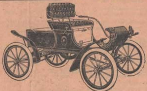
Stridsvagn ur Nordstatens pansarförband

Mycket annat skulle vara att säga om ettappgruppen. Man kanske får begränsa sig till att framhålla, att man numera strävar efter att göra förbandet till en organisation med moderna och rationella arbetsmetoder. Vi kan säkerligen var och en bidra till att det lyckas.