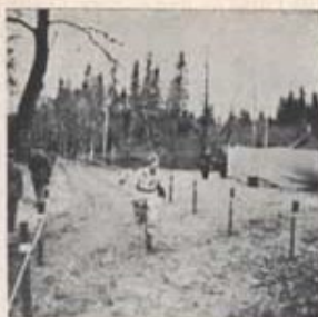
T 4 segrade i budkavleorienteringen.

Varje år tävlar förbanden inom 1. militärområdet i budkavleorientering för 3-mannalag. I år arrangerade KA 2 tävlingen den 13—14 april med Karlskrona som samlingsplats.