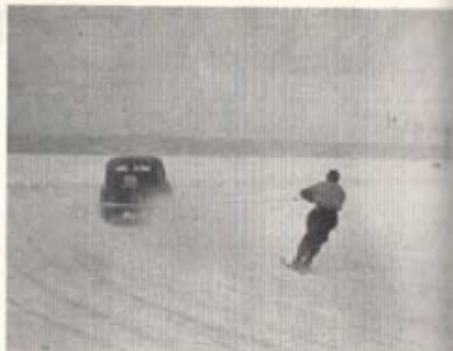
I 90 kilometers fart!

Så pauserade man då och styrkte sig med kaffe, varm buljong, varm korv eller annat som serverades från regementets marketenteri, för dagen fältmässigt etablerat i ett stort tält. Där regerade marketenteriförståndaren, fanjunkare Stig Darpö, som