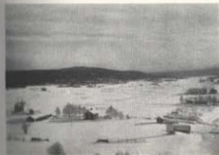
Malungs by från kyrktornet.