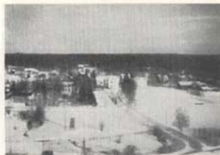
Malungi folkhögskola där sjukvårdskompaniet låg förlagt.