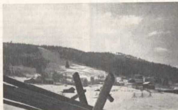
Hallstabacken — en plats, där många iörläningar funnit den "blåglå" järgen.

Den andra och sista övningsveckan bröt in med tö och slask, vilket för oss blev ännu mera paradoxalt, då söderifrån kommande rykten förmälde att meterhöga drivor förlamat hela konungariket Skåne med omgivande provinser. Vi tillbringade en natt i tälthyddan m/59 och roade oss med att fingera snödjup, tältvärme och sömn. En dag åkte vi 3 mil på skidor, varefter snön tog slut och sista dagen fick ägnas åt ett populärt och intressant besök på Arméns hundskola.