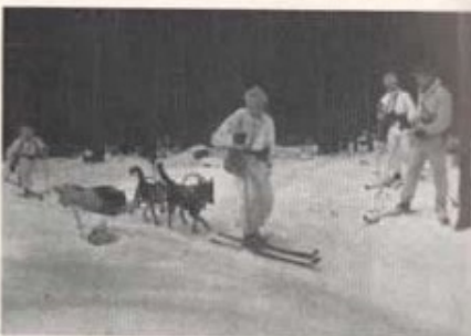
Bärlag med hundspann återvänder med en släde.