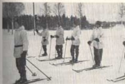
Beredda till verksamhet i ny miljö.

Redan på söndagen dristade sig många av oss ut på de redskap att förflytta sig på i Lappland, som de initierade kalla skidor. Det lär ju vara vackert att glädja andra, och sannerligen utträttade vi inte stordåd! Under mängdens jubel avverkade vi Hallstabacken med en nonchalans som gränsade till likgiltighet. Med minen av en, som har ett flertal fjällrävar bakom bägge öronen, kastade vi oss djärvt utför.