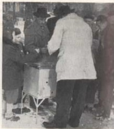
Vems är ryggtavlän?

Alltnog, en riktigt trevlig heldag var till ända och de som varit med på Finjasjöns strand och kanske frusit en smula om tårna och på nästippen tänkte nog alla, att arrangemang av detta slag, som så lyckligt förenar det nyttiga med det nöjsamma, är utomordentligt värdefulla och just därför värda att upprepas kommande år.