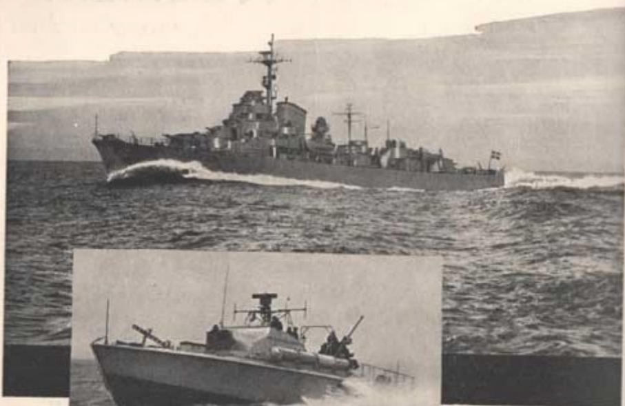
Jugare, deplacement 1800 ton

har byggt krigsfartyg till den svenska örlogsflottan sedan 1875. År 1953 levererade varvet 11 handelsfartyg om sammanlagt 178.960 t. dw.