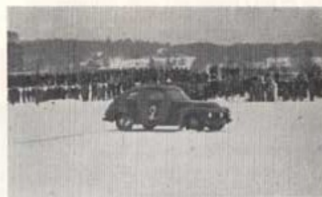
Med 80 km fart behövdes 90 meters bromssträcka med standarddäck!

Och kanske att det är alldeles särskilt viktigt för oss som bor här i Skåne att vara litet misstänksamma mot vattnen när de drar på sig vinterdräkten. Man vet nämligen icke hur länge den dräkten får sitta på. Ty även vattendragen i Skåne känner väl att de äro hemma i den del med vilken vårt land väkominande sträcker ut handen mot den anslående våren och bjuder den flyende sommaren ett sista farväl. Och Skånes vattendrag föredrar ju sommarens lätta böljedräkt framför en vinters ispannar. Det fordras alltså en fortgående upplysning och undervisning för att lära oss förstå vattnet i sommar och vintergestalt och för att lära oss att umgås med våra sjöar såsom med pålitliga vänner.