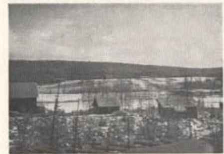
... underbart vacker natur i den härligaste vinterdräkt.