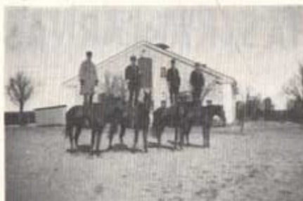
Fyra står på fyra hästar.