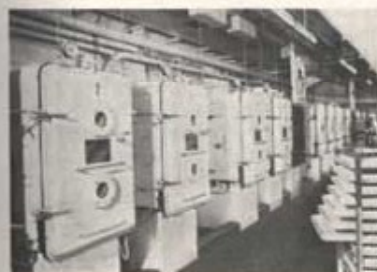
I vakuumpackarna konserveras maten vid mycket låg temperatur utan tillsats av artificiella konserveringsmedel.

Trängarna måste dock följa med utvecklingen för att bedöma var man måste föreslå ändringar och förnyelse. Vi måste göra detta själva och icke lita till att andra gör oss uppmärksamma härpå. Man måste också komma ihåg att nya uppgifter icke betyda att truppslaget endast skall växa i omfång. I stället måste man sovra och byta ut, ty den styrkeram, som vi nu räkna med, kan vi av ekonomiska och personella skäl säkerligen icke alltför mycket överskrida.