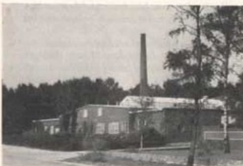
Fabriken i Halmstad.

Fabriksanläggningen är belägen i ett utpräglat jordbruksdistrikt, vilket betyder att såväl kött som vegetabilier komma till fabriken i bästa skick och bearbetningen kan ske just när varan är som bäst. Halland och Skåne leverera grönsaker, rotfrukter och frukt. Bohuslän och Mälardalen leverera färnska nypon och från Norrland kommer blåbären, vilka djupfrysas omedelbart efter plockningen och transporteras till Vato på järnväg med specialinredda kylvagnar. Rotfrukter som anlända till fabriken tvättas, spolats och borstas först innan de skalas, vilket sker i en automatisk skalanläggning (kapacitet ca 1 ton/tim.). Sedan tvättas rotfrukterna på nytt innan de går in i köket, där de trimmas vid ett löpande band så att inga skämda eller skadade partier kunna följa med i den vidare behandlingen. Efter detta skäras de ned i tärningar och underkastas ett hastigt uppkök — blanchering — för att förstöra vissa enzymer, som på kort tid annars bryter ner för näringsvärdet viktiga substanser. I köket behandlas också köttvarorna, som levereras av Halmstad Slakteriförening. Köttet kokas tillsammans med andra ingredienser till färdiga rätter t. ex. polska, ärtsoppa med fläsk och liknande. De färdigställda rätterna läggs upp på aluminiumplåtar s. k. ollor vilka på transportvagnar föras till vakuumpackarna, där ollorna sättes in i särskilda segment med värmelement som strålar värme ner på livsmedlen. Sedan ollorna insatts