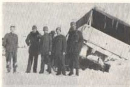
En icke ovanlig händelse under de långa körningarna. "Vägrenen är icke bärig" — som det så bögtidligt heter på en del vägs skyltar i Skåne.

kyligt var det under måltidsuppehållet i Boden och utevistelsen där inskränktes till det minsta möjliga. Där möttes vi av order från vår nye chef, som var fo-befälhavaren i Kiruna. Vår första uppgift skulle bli en personaltransport. Ett par infanterikompanier skulle för avlösning upp till Karesuando och på återvägen skulle de avlösta förbanden åka med. Vårt tåg skulle vara framme i Kiruna kl. 16.45 och avmarschen för transporten till Karesuando var utsatt till kl. 16.00 påföljande dag. Återstoden av järnvägsresan ägnades helt naturligt åt planering av den kommande 40-mila transporten, allt i lycklig okunnighet om att den stränga kylan gjort våra bilar obrukbara för en så snar körning.