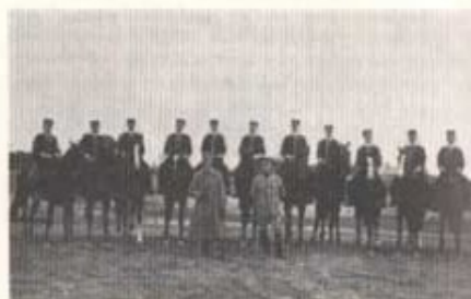
Färriskolan T 1—T 4 vid T 4 1933.