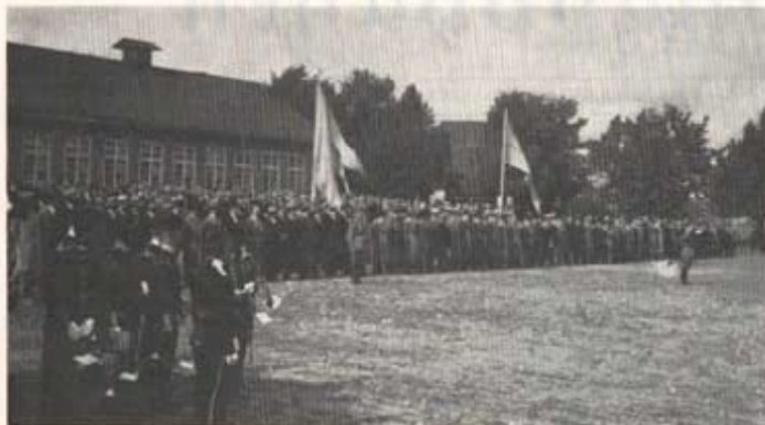
Av BIRGER BRUNNBY