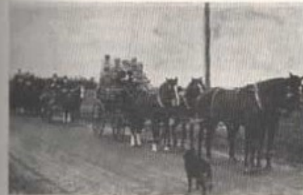
Efter avslutad jakt åkte man hem så här, 1933.

Det var kanhända detta förhållande jämte vissa dressyr- och avelsproblem som gjorde vår körutövning