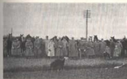
Deltaägarna samlade på Vankiva-fältet efter avslutad jakt, 1933.

Själv fick jag tillfälle att stifta närmare bekantskap med Lord under sommaren 1931, då jag hade honom som gruppchefhäst på en anspannspluton. Läraktig och beskedlig som han var, lärde jag honom att sköta sig själv under raster. Om jag ställde honom i kön av grup-