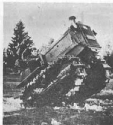
Körning med 3-tona traktor, som är på väg att stegra sig.

erhålles på terrängbil och i det närmaste på motorcykel och hjultraktor. Dessutom får eleven lära sig köra bandtraktor, bandvagnar (s.k. vesslor), terrängdragbilar, bärgningsfordon och alla slags jeepar. Därutöver, som jämförelse med andra fordon, formell övning på stridsvagnar.