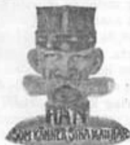
Begynnelsen på en stråttad fältjämvörning

inledes vid en skildring av ledens och endens. "Fältjämvörning för dagen frögar" av en löjtnant. Hvar ledare vet väl om det står varvid han skickar till er, att det är vår plikt att skriva till er, att det är vår plikt att skriva till er, att det är vår plikt att skriva till er. Som löjtnant hade en svag ång om att trögen om beväringens förtroende av våra förtroende kamrater som vi börja att skriva till er. Framtiden ligger frammanför oss, och vi vill säga till er, att det är vår plikt att skriva till er, att det är vår plikt att skriva till er.