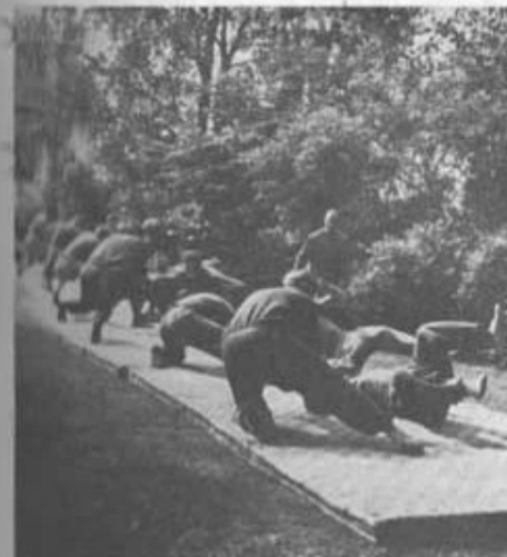
Instruktion i att med ett hastigt grepp fälla motståndaren till marken.

Närkampen bygger i största möjliga utsträckning på reflexrörelser. Sålunda fingo eleverna lära att alltid — oberoende av situationen — inta en kamptällning med höger ben framme och höger arm höjd som skydd för huvudet. Redan inövat av denna grundställning gav eleverna en försmak av hur noggrann utbildningen skulle bli. Varje detalj övades 50, 100, ja ibland 200 gånger,