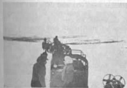
På väg till fjället med bandvagnar.

Tiden räcker inte att ge eleven fullständig utbildning på alla motorfordonstyper, men sådan