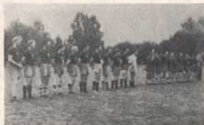
Finalisterna i regmästarskapet i fotboll; 2. komp (närmast) och 9. komp.

Tyvärr började det regna då domaren, sergeant Önnhagen, blåste till spel och Göingevallens mata blev allt halare under det envisa regnandet