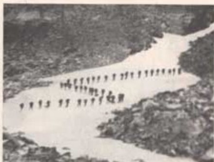
Uppbrott från Reitasvasge.