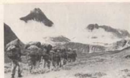
Sommarmarschen 1956. Unna Reitasvasge. I bakgrunden Pyramiden.

Färden gick över Nissonjokk, följde Kungleden förbi Abiskojaure mot Vuolle Allesjaure—Paijeb—Tjäddejokk—Vistasdalen med Vistaskåtan och Vistasstugan. Efter behövlig uppladdning av förråden och vila fortsatte marschen över Unna Reitasvasge—Pyramiden—Knivkammen. Nu hade marschen övergått från den mera plana terrängen till en svårframkomligare. Dagsmarscher i block-, snö- och glaciärräng och med ett ständigt sti-