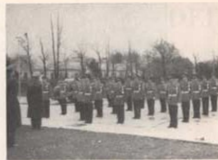
Chefen för det danska Livregimentet tar emot T 4 musikkår.

I samband med firandet av Regementets dag kunde regementschefen fäste de närvarandes uppmärksamhet på att det var sista gången, som T 4 firade "Regementets dag" med egen musikkår och att regementet denna dag hade glädjen mottaga besök av musikkåren vid det danska Livregimentet. Dagens festligheter kom också att i mångt och mycket präglas härav: