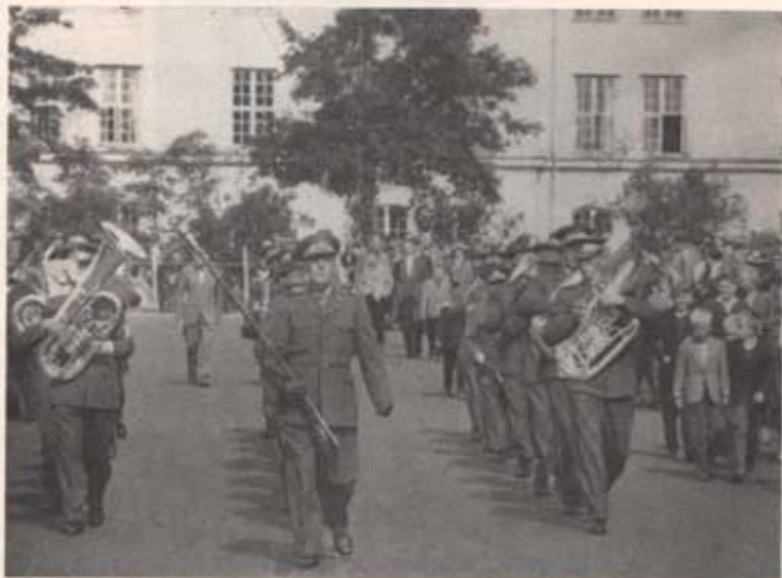
Den danska musikkören marscherar till platsen för förbimarschen på Trånggatan.