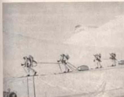
Vintermarschen 1956. På isbelagd sjöar uppe i Lappporten.