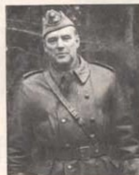
Förordnade överstelöjtnanten Gösta Schyllander