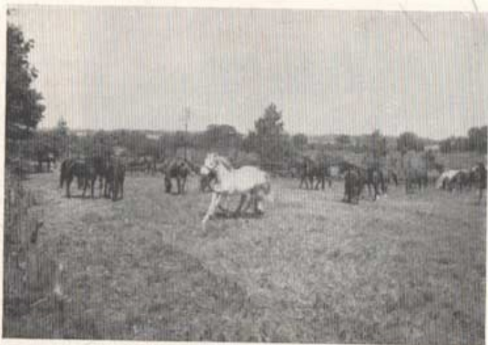
En syn, som väl aldrig kommer igen: T 4 ridhästar på sommarbetes. (1948).