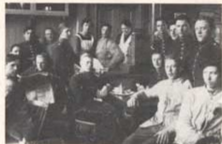
Markeentusiast i Hässleholm.