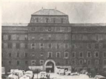
Stiftskaseren i Wien. Utgångspunkt för transporterna till Budapest.

Alla gåvosändningar samlades i Wien på ett stort centralförråd varifrån rekvisition fick ske. Färskvaror såsom bröd fick vi själva ombesörja och jag gjorde upp avtal med nio bagare, som levererade de 1600 kg vitt bröd som gick åt dagligen.