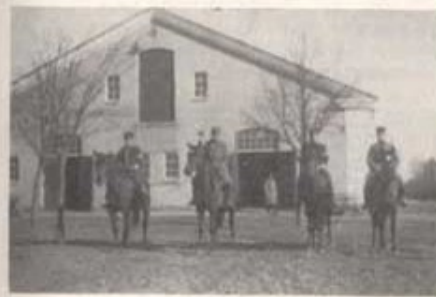
Remonsträttare framför stamstället.

Frågan om ett nytt hotell pockade på sin lösning på grund av den stora resandeströmmen. Genom Hässleholms centrala läge blev köpingen alltmera begärlig som plats för sammanträden och sammankomster av ena eller andra slaget. Inom fullmäktige fanns ivriga förespråkare för hotellfrågan och så tillkom år 1912 Hässleholms Stadshotell. Att det redan från början fyllde ett stort behov, framgick med all tydlighet av den livliga frekvens, det redan från starten kom i åtnjutande av.