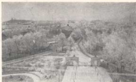
Utsikt mot staden från kanslihuset (1910).

i Landskrona. Här tillkommo bl. a. sådana nyheter som tvätt- och toekrum samt särskilda rum för det äldre underbefället.