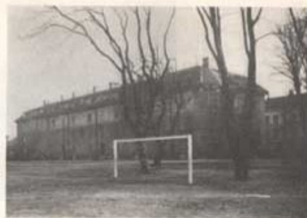
Adolf Fredrikskasernen i Landskrona.

Kasernbyggnaden var uppförd i tre våningar med brutet tegeltak, försedd med vindskupfönster. Den låg längs Slottsgatan med östra flygeln mot Rådhusorget och den västra mot musikparken. Manskaplogementena voro små och mörka, trapporna branta och murarna tjocka. Här hade en gång "Kronprins Gustafs rege-