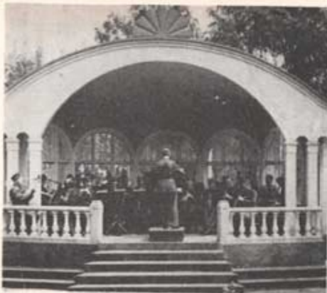
Den 1 april 1957 upplöste officiellt T 4 musikkår att finnas till. Jämt armåder skulle även bilda avvecklingsorganisation istället för personalen omflyttats till andra musikkåror. Bilden till vänster visar musikkåren under en av de så populära lunchkonserterna i regementets vackra musikpaviljong.