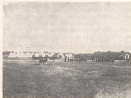
Läger i Landskrona (1890).

Hade förläggningen varit dålig och trång i Karlsborg, blev den rent av jämmerlig under första tiden i Landskrona. Wendes artilleriregemente hade alltså år 1830 varit delvis fördägligt i Adolf Fredrikskasernen i Landskrona och hade där gamla anor. Vid tiden för träng-