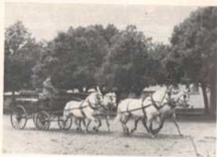
Fanjunkare Lindén ger en perfekt uppvisning med 4-spänn (1949).