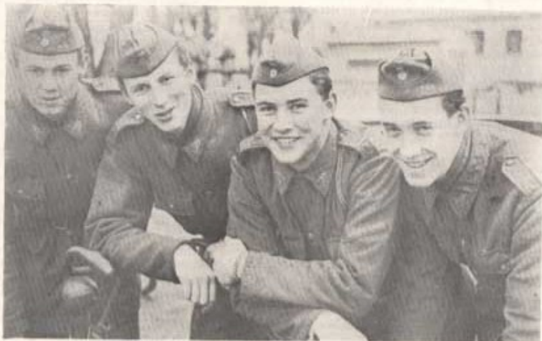
Segrande laget i 6. komp. fälttjän: fr o vpl Lynhagen, 371 Andersson, 365 Nilsson och 415 Holmberg.

19/2—22/2 Under regementschefens ledning deltar regementet i förbandsövning med underhållsgrupp.