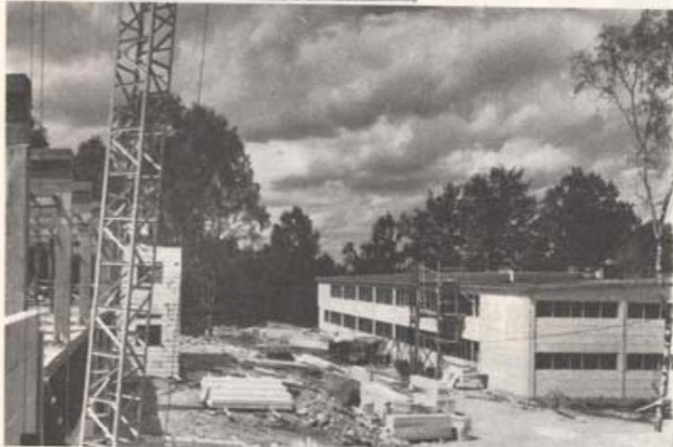
Men annat tillkommer. Här en bild av de två nya kompanikasernerna, som är under uppförande i Stora parken väster om matsalen och som beräknas bli klara för inflyttning före årsskiftet 1957-58. Då kommer regementet att i sin helhet vara förlagt till Hälsöholm.