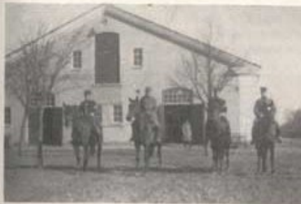
Remonstrerare framför stamstället.