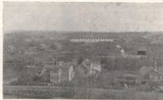
Utsikt mot insendenturföräldet från kanslihuset (1908).

När höstregnen började falla, förvandlades vägen söder om kasernen till en enda stor gyttejöl. För att råda någon bot på eländet anlades på den östra sidan av vägen mellan avtavgsvägen till Vankiva och vägens närmaste backkrön en ca 1,5 meter bred gångbana genom att trängmanskapet påkörde grus och aska från kasernen.