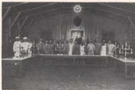
Julfest i Motala (1917).

Belysningen inom samhället var mycket bristfällig och bestod mestadels av svagt tändande fotogenlampor. Järnvägsområdet hade acetylenbelysning. Efter en explosion av denna, varvid en man dödades, blev belysningsfrågan aktuell även för dess del. Silunda tillkom efter en del förhandlingar Häsleholms elektricitetsverk väster om järnvägen. Efter en tid anknöts det till Sydsvenska kraftaktiebolaget.