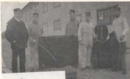
Utdrag ur "havndförskådet" (1915).

Förvaltare Örtlen - blad. med förråds- personal utan för- huvud förrådet 1915