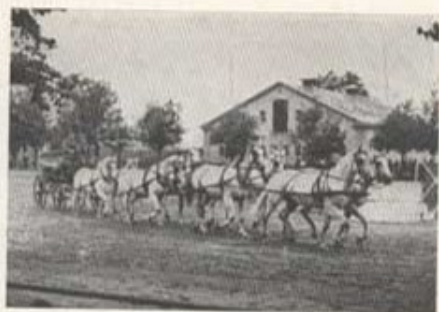
Fanjunkare Bergström ryglar med fasta händer sitt stolte vita 8-spänn (1949).