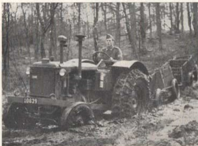
...traktorerna, som också har bra framkomlighet i terrängen.