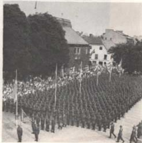
Regementet paradade för H.M. Maj: Konungen under denna Eriksgata 1952. Paraden ägde rum på Stora torget i Kristianstad den 11 juli och försom T 4 deltog P 2 och garnisonen i Kristianstad.