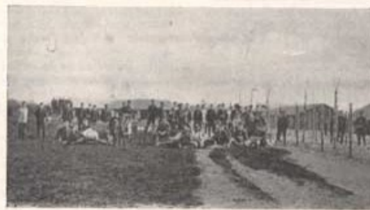
Lägre i Landskrona (1898).

Varje trängkår hade att uppsätta ett 40-tal förband vid mobilisering. Helt genomförd tog den en avsevärd tid i anspråk. Den lilla befälskåden var alldeles otillräcklig härför. Den mängd hästar och fordon, som ingick i mobiliseringen skulle mönstras i bestämda samlingsplatser inom inskrivningsområdena och sedan marschades föras till trängkårens förläggningsorter för organisation och utrustning. En förläggning vid kusten ansågs alltför riskabel på grund av de störningar, en företagsam fiende skulle kunna åsamka med sin flotta under den långa mobiliseringen.