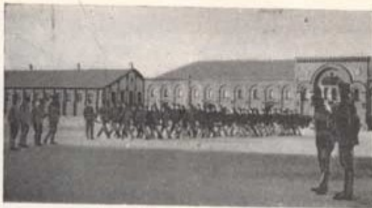
Exercis på kaserngården i Landskrona. I bakgrunden gymnastikhuset och tyghuset (1900).

stort som en vanlig gymnastikal och ursprungligen avsett endast som plats för vanliga militära övningar men sedermera försett med gymnastikinredning, varför det även användes för gymnastikutbildningen. Under vintern och vid i övrigt otjänlig väderlek, särskilt då kalla och regniga stormar från havet svepte in över kaserngården, var det fyllt av olika utbildningsavdelningar.