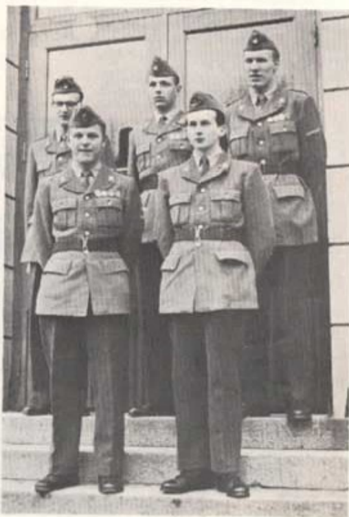
"Främste soldaten" vid övriga komp: