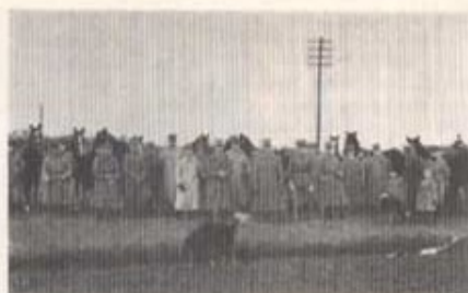
Efter jubileum på Vankiva (1933).

Men allting var så bristfälligt och den ena förbättringen hade en annan till följd. Skattekrönornas antal var ej stort. Skatten var visserligen låg och tålde väl någon höjning, men ingen önskade det, varför den stör-