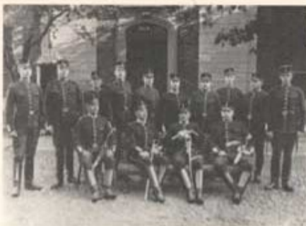
Rekrytkölan 1899 framför Adolfs Fredrikskasernen i Landskrona.

De orter, som ansågos kunna komma ifråga för Skånska trängkåren, voro Kristianstad, Växjö och Lund. Samtliga dessa orter fyllde de av generalstaben uttalade önskemålen. Dessutom möjliggjorde de samövningar med andra trupperband. En annan viktig sida av saken var, att de kunde erbjuda de inflyttande familjerna erforderliga bostäder och möjligheter till barnens skolutbildning m. m.