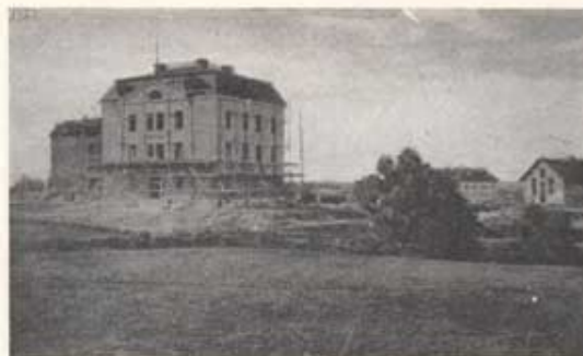
Hälsingborgsförläggningen under uppförande (1903). Ovan kanslihuset och t. h. stället och ridhuset.

Några planteringar funnos ej utom de tre avenyerna, vars pampiga namn då ej gjorde rätt för sig, men vars upphovsmän tydligen skadat in i en glänsande framtid. Nuvarande Stadsparken var enskilda trädgårdar. Sålunda fanns det för övrigt gott om, mest i form av små