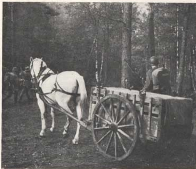
Hästarna vid T 4 föresinner 1950 och lämnar plats för...