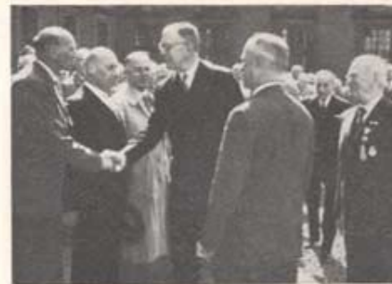
Konungen hälsar på prins Viggo av Danmark.

Samarbetskommittén hade här lyckats över förväntan. Dels var stället det förmämsta, som kan tänkas och dels var vädret det allra bästa, vilket gjorde att skärgården visade sitt allra vackraste ansikte. Det blev mycket folk församlat, när galafesten började kl 1900. Sedan var och en funnit rätt på sitt gäng och dessutom lyckats placera sig på en stol bakom ett kuvert, kunde läckerheterna angripas. Efter hand som det våta rann ner i struparna klarades dessa för talens mångfald, allt medan varmrätten kallnade och glassen blev varm. Rekord i tallängd uppnådde en norsk marinkam-