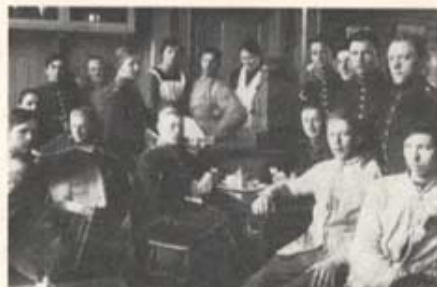
Musikkåren i Hässleholm.