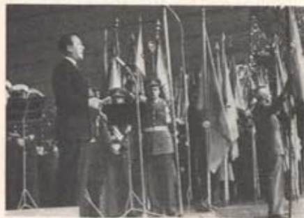
Föresvarsministern, statsrådet Sven Andersson, talade i Kungsträdgården.

Sedan studietimmen var avverkad, bjöd företaget på en strålande långlunch, där allt gavs och ingenting saknades och där förbrödningen började antaga sådana former att begreppet kamratfest blev gällande.