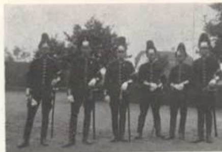
Underbefäl i paraddräkt (1918).