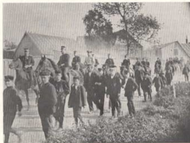
En unik bild från Skånska trängkårens marsch till den nya kasernen efter aflastningen på Hässleholms järnvägsstation den 3 oktober 1907.

Därvid föll han ned mellan vagnarna samt fick några skador, dock inga lifsfarliga."