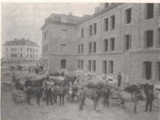
D-kasernen under uppförande (1903).

Kasernbyggnaden var betydligt modernare samt invändigt ljusare och trevligare än motsvarande byggnad