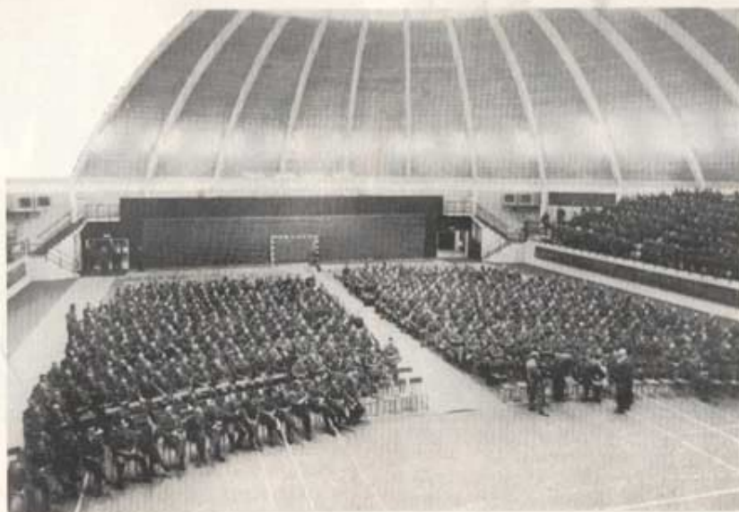
Publikbild från Idrottshallen.

Som avslutning kan sägas att det nu snart tilländalupna året 1957 ur T 4:s synpunkt varit ett gott skjutår. Det är emellertid sektionens önskan att så många som möjligt av den aktiva personalen under det kommande året försöker deltaga i så många som möjligt av sektionens skjutningar.