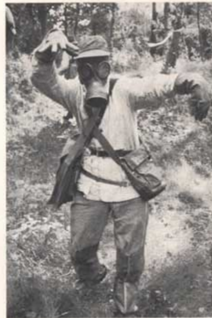
Felände läken i övergången mellan den traditionella krigsföringens era och atom- och spankildens skede. En anskönlig figur är han, soldaten m/57, men effektiv med vapen i hand och en lastig kurre under axeln.

Jag är soldat av årgång 57 och har av stabschefen fått äran att medverka i Snapphanens spalter med några intryck av livet vid T 4 sett ur manskapets synvinkel. En tyvärr begränsad synvinkel och ur ett perspektiv som ligger någonstans mellan grodans och knähundens. Även om skildringen blir "von unten" kan redan i ingressen göras klart att några "sensationella bottenskrap eller avslöjanden" inte förekommer i artikeln. Lyckligtvis behövs det inte. Korpral Himmelstoss har gudskelov inga bröder här, vare sig bland befälet eller i kasererna.