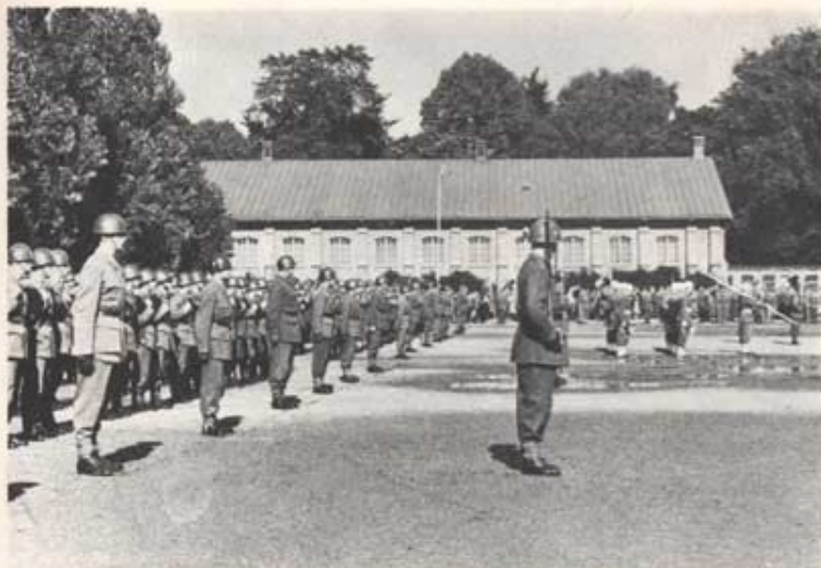
Regementet uppställt för paradering på Adolf-Fredrikskaserne:s gård i Landskrona. I bakgrunden det gamla exercisburet. Hitom detta bar de frivilliga försvarsorganisationerna ställt upp.