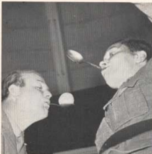
Potatisstafett var en båd gren.