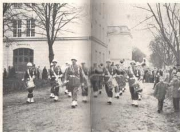
Arméns musikkår leder marschen till paraden på Tränggatan.