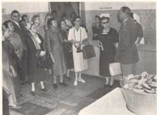
Artikelför. propagator för ökat ekonomiskt flyktingsöd inför amerikanska pressrepresentanter i Korneburgslägers "matid".

Finansieringen av detta stora företag har till större delen skett genom gåvor i pengar och varor, som förmedlats genom Röda Korsorganisationer i hela världen. USA:s regering har stött arbetet genom att under speciellt dess första skede ställa omfattande livsmedelsförråd och förråd av lägerförnödenheter till förfogande ur militärdepåerna i Tyskland. Ser man på den svenska insatsen, märker man ögonblickligen att den varit såväl proportionellt som reellt av stor omfattning. Statsmakten i Sverige har förutom med viss sjukvårdsmateriel bidragit med 10 milj. kronor för att taga hand om flyktingars transport till Sverige och deras omhändertagande här i landet. 7 milj. kronor ha ställts till flyktingkommissariatets förfogande för hjälp åt "gammalflyktingar", varjämte 0,5 milj. kronor överlämnades till FN såsom bidrag till Ungernhjälp under dess första skede. Radiohjälp och Röda Korsets insamlingar ha tillsammans nått ett belopp av ca 17 milj. kronor, till vilken siffra måste läggas värdet av skänkta kläder, som kan uppskattas till omkring 7 milj. kronor. Vidare bör i detta sammanhang nämnas, att av alla s k grundvaror, såsom margarin, chokolad, torr mjölk och vacuumtorkad barnmat m m, har från svenskt håll levererats närmare hälften av flyktingoperationens totalbehov. Hjälpviljan i vårt land har än en gång givit ett storartat resultat.