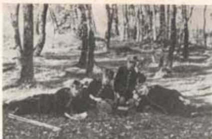
Signdaträning 1909: fälttelefon och signdflaggor.