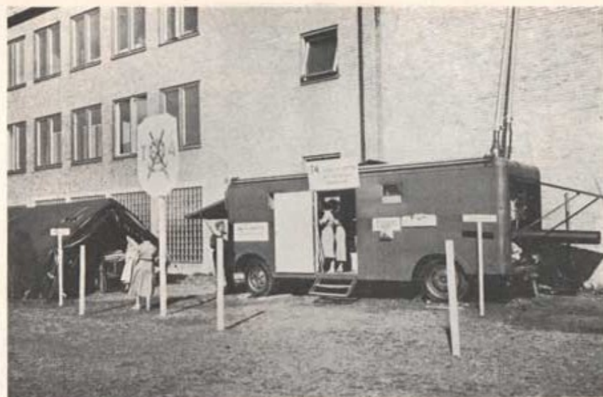
Del av T 4-utställningen i Trelleborg 4/7—13/7. På bilden syns tvättvagnen, där många trelleborgare fick sina tvättkläder tvättade.

30/5 Tar militärbefälhavaren mot åldersklassen och inspekterar regementet.