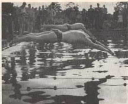
Start i 100 m fritt simstätt vid regementsmästerskapet 1956 i Vinslövsbadet.

nastikkretsens program år 1931 och samma år anordnades stadens första seriehandboll. STI ställde i denna serie upp med två senior- och ett juniorlag och placeringarna blev 2:a och 3:a resp. 1:a. Spelåret 1932—1933 vanns seniorklassen av lag 2, som därigenom blev Hässleholmsmästare.