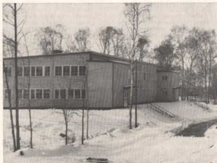
En av de nya kasernerna.

24/5 Rycker repetitionsövningsförbanden i våromgången ut.