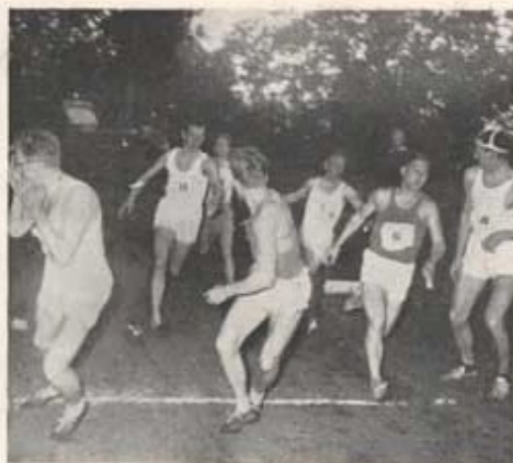
Stafettövning vid regementsmästerskapet 1954.

Intresset för "stjärnidrotten" har inom föreningen under senare år alltmör avtagit. En av orsakerna torde vara, att det i Hässleholm nu finns en specialförening, som med stor framgång bedriver allmänidrotten. Sporadiskt representeras dock fortfarande föreningen vid tävlingar utåt, även om det största arbetet och mesta intresset för en ägnas åt anordnande av plutonstävlingar, kompanistafetter, regementsmästerskap och idrottsmärkesprov. Av resultaten från dessa "utombystävlingar" märks bl a fem lagpris i terränglöpning, som erövrats av STI juniorer.