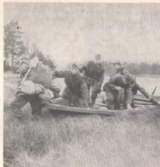
Överskeppningen på Stjärneholmsjön.

Vi möts på vinterträffen som går av stapeln någon gång i februari. En vacker vintersöndag, hoppas vi.