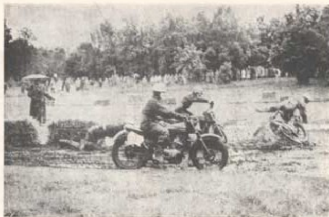
Motorcross på "Regementets dag".

hindergräns och förband sig även att ställa personliga priser till förfogande i denna tävling.