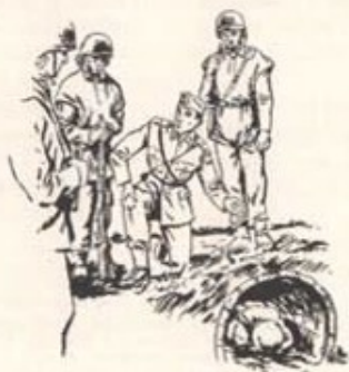
Utbildningen inom armén har under flera år bedrivits med hänsyn till risken för att en motståndare använder kärnan.

Något humant är svårt att finna i att vi själva skulle avstå från atomvapen i strid mot en motståndare som har detta vapen. Det humana ligger i den livsform, till vilken vi bekänner oss. Om vi vill att den skall överleva, måste vi vara beredda att försvara den med lika bra vapen som den har, som hotar oss. Det verkligt barbariska vore väl att riskera att vi på grund av vår svaghet utsätts för ett angrepp som vi, om vi vore tillräckligt starka, inte hade behövt riskera.