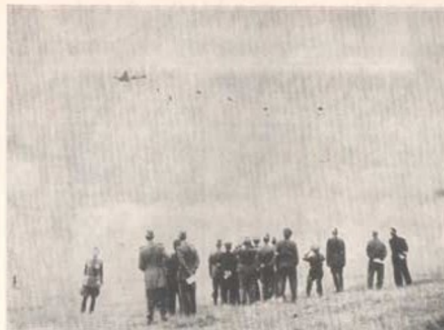
Underhållstjänsten lämnades överdes under höstfälttjänstövningen.

2/10—8/10 Deltar repetitionsövningsförbanden och viss del av åldersklassen i av militärbefälhavaren ledda fälttjänstövningar. Vissa förband började redan 29/9. Det var transportbataljonen, som fick utföra omfattande ammunitionstransporter. Övningsändamålet för av regementet uppsatta förband var att öva underhållstjänsten i samband