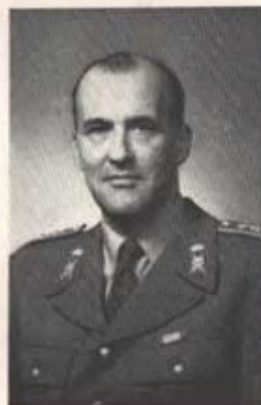
Overstelöjtnant Folke Nordström

Född 22/4 1911 Fänrik i I 16 15/4 1932 Löjtnant 17/4 1936 Kapten 1/7 1942 Kapten vid generalstaben 1/10 1944 Kapten vid trängens 1/4 1949 Major 1/10 1949 Overstelöjtnant 1/10 1955 Placerad vid T 4 1/10 1958