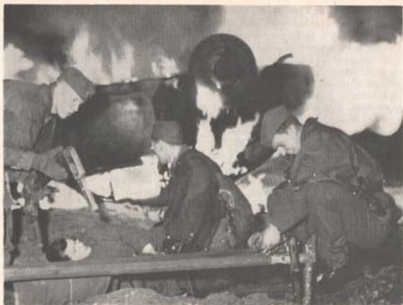
Den dramatik finalen i Mala grupp.

oväntade möjlighet till sömn tillvaratogs, då det meddelats, att vi skulle fortsätta klockan 1945 och inte få en blund i ögonen sedan under natten. Fastän sömnen ej blev så lång, vaknade vi upp märkbart piggare och satte omedelbart igång med matlagningen. Elden i kokgröparna hade underhållits av den personal, som rest tälten åt oss. Konservburkarna innehöll denna gång wienerkorv, till vilken äts kex och choklad. Vattenflaskor och termosar fylldes med vatten. Kokgröparna fylldes igen, och ett livligt spadbyte försiggick. Traktorn tankades och packningarna spändes på cyklarna, som hade svårt att hittas av sina ägare i det kolsvarta mörkret.