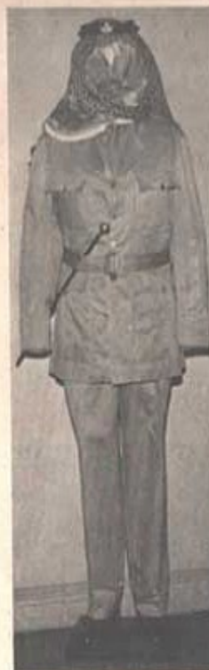
En uniform för major i arablegionen visas bl. a. i regementetsmuseum

1:a Avenyen 1 (vid Järnvägsstationen) HÄSSLEHOLM Telefon 103 98