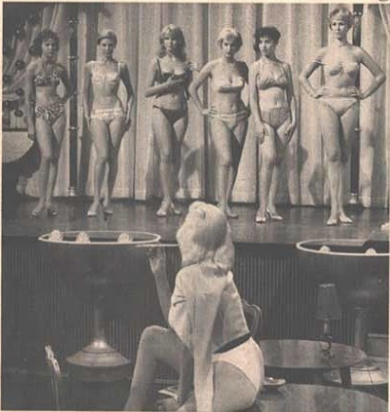
Vi undanhölls vi detta?