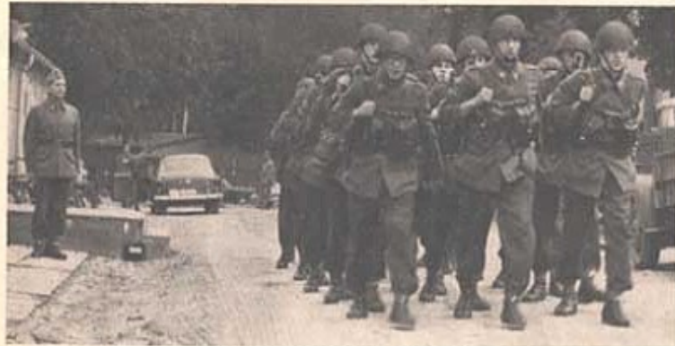
Exercisen gör en man till en pluton

En annan avsigdighet är exercisövningens förmåga att framkalla en hel del fula drag hos människor. Även om —