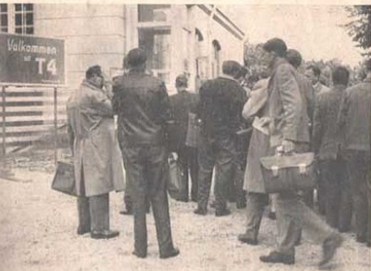
"Välkommen till T4" stod det på skylten bredvid anvisningstavlan utanför kavarekuten, där de inryckande togs om hand av trafikpersonal.