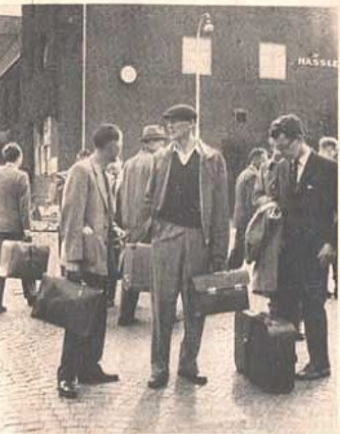
välkomna på busstransport från Hässelholms station till T4 njuet de inryckande med välbehag av salsketen.