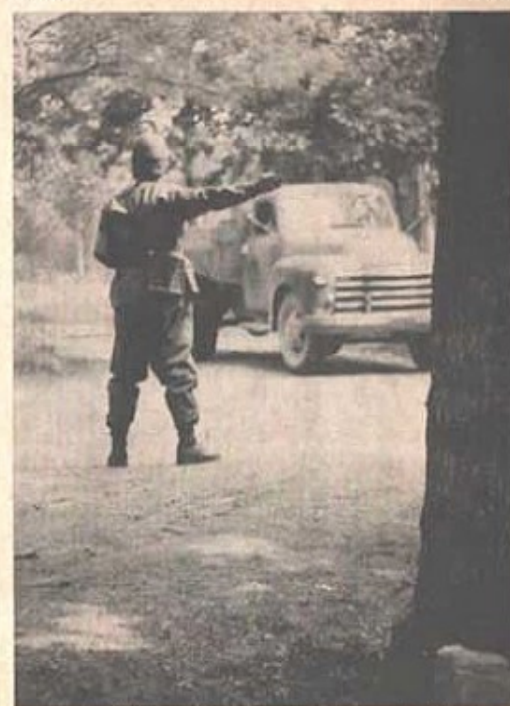
Han är alltid på plats för att visa dig in på rätt väg.