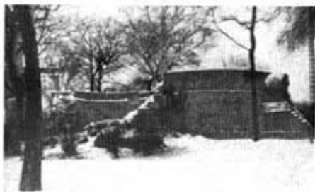
Räiset av "Jarnmans torn" i Köpenhamn. ett minne från vendernas tid.

ras ideliga attacker var ju en följd av deras eget desperata läge, men för våra förfäder tedde de sig som sända av den lede själ. Hela härader var till sist folktomma, och sannolikt hade ödeläggen en vacker dag följts av vendisk bosättning, om ej Absalon varit.