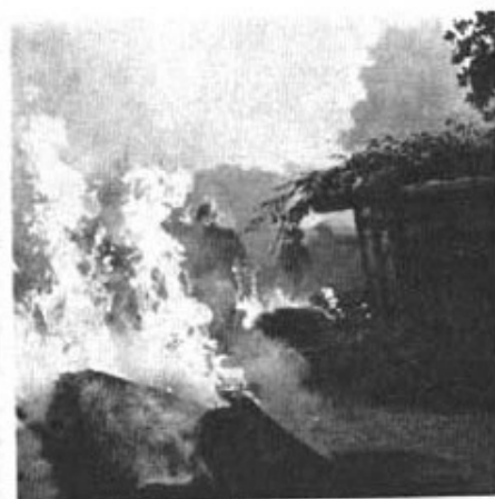
Riddnings- och sällningsstyckas insittande.

Samtidigt som underhållsförbanden ställs inför allt mer krävande uppgifter ökas svårigheterna på grund av nödvändigheten att gruppera ut trupperna över allt vidsträcktare områden, operationernas snabbare förlopp och den omständigheten, att