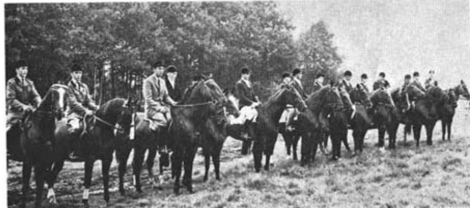
Ryttarna under samling för privatdelning.

— Jag instämmer gärna i det tack, som regementschefen nyss riktade till alla dem, som under gångna år har bidragit till utvecklingen på underhållstjänstens område och till den böga utbildningsstandard, som har karakteriserat detta regemente inte minst i senare tid. Regimentet är, som