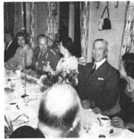
Från den gemensamma middagen i regementets matid.