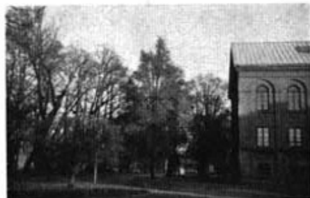
Vid det ovanstående "Landskap" låg ärkebiskopens gård med samma namn.

Att också de verkliga Absalon var en kraftkarl, framgår likväl av de ställen hos Saxo, där han trots allt måste kritisera sin idol. När t. ex. Absalon utsågs till ärkebiskop, ställde han till en scen i Lunds domkyrka, som var föga värdig men dock vittnade om hans kraftnatur. Kanske kom det överraskande för honom, när han vid ett stort prästmöte i domkyrkan av sin förman, den överårige Eskil, blev föreslagen till hans efterträ-