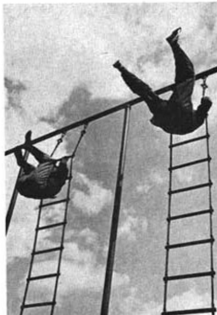
Tid väpningsövning under femkampsträning.

Tävlingsarna gick i år med start på ArtSS. Trots att tävlingsarna var väl planlagda och ledda var nog inte svårigheterna av den plan man kan begära. Det skall emellertid erkännas att vägnätet är mycket klenlert varför det inte är lätt att lägga upp en verkligt svår bana.