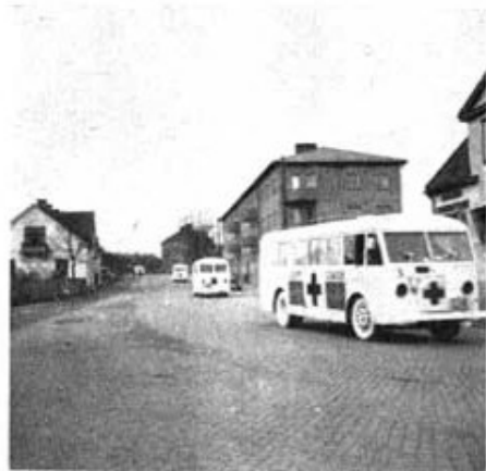
De vita bussarna på väg från kaseri söderut.