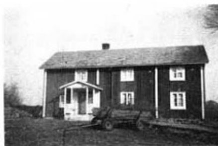
Gård i Kongstorp. Där legenden felaktigt placerat Karl XI under Loshultskuppen.

Detta var första akten — och den mest dramatiska. Den andra blev snarast en komedi. Man skulle ju tro, att de kärror och peng, som kom undan upp i Småland, och där ställdes under bevakning av talrikt manskap, utkommenderat av en länsman, därmed skulle ha varit i säkert förvar. Men det var just fin hjälp, man fick! Redan