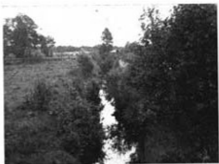
Den gamla gränshäcken Getahäck. Här finns ingen tall — och Janus själ inte heller.

längre tids kringhoppande på de "ondulerade" fästigar, som kallades landsvägar, fick den inte vara för tungt lastad.