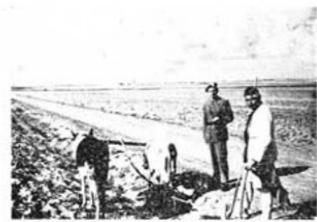
Vid vägen längs ADL. Jordbruksarbete med älderdomliga redskap betraktas av författaren.