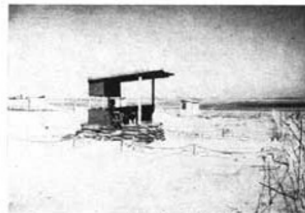
Observationspost, varifrån demarkationslinjen bevakas.

3/7-18/8 Fackutbildningskurs för värnpliktiga läkare är förlagd till T 4. Kurschef är regementsläkare Hagberg. 12/7-13/7 4. kompaniet bedriver övningar i trakten av Luhrsjön. 13/7 Regementsmästerskapet i simning äger rum i Vinslövs friluftsbad. Mera härom i idrottskrönikan. 16/7 Sommarupphället börjar för åldersklassen. Vpl grp A är lediga t o m 24/7 och vpl Ah t o m 29/7. Grp K får sitt övningsuppehåll 24/7-29/7 medan plutonscheferna delas upp i två omgångar, 17/7-22/7 och 24/7-27/7.