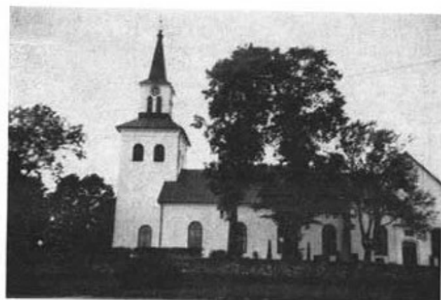
Loshults kyrka i sitt omödelbara närhet anfallet delvis sattes in.

Någon kanske undrar, hur kassan kunde utgöra huvuddelen av trängen, i synnerhet när man hör, att denna träng bestod av 250 kärror! Förklaringen ligger i de svenska myntens fantastiska utseende. Det var väl världens i alla tider största och obekvärmaste mynt. Sverige hade föga silver men däremot en till synes outtömlig koppartillgång i Falu gruva. Av nationalekonomiska skäl hade man därför länge tillverkat de flesta mynten av koppar. Bl. a. räknade man med att hindra prisfall ute på världsmarknaden genom att lägga beslag på största möjliga kvantum för den egna myntningen. Då man dessutom ansåg det praktiskt att ha hög valör på mynten, måste dessa få en avsevärd storlek. Att man likväl i detta stycke gick litet väl långt, tycker vi nog, när vi hör talas om en tiotaler från den tiden. Detta mynt erinrar mest om en pansarplåt. Den bestod av en fingertjock kopparplatta, 70 cm lång och 30 bred. Den vägde över 19 kilo! En åttadaler var förstas mindre men vägde dock 14 kilo. Det vanligaste myntet var endalerna å 2 kilo. Sådana mynt var ingenting för ficktjuvar. De fraktades mycket bättre i vagn efter häst än i en ficka. Det stora antalet vagnar i trängforan vid Loshult är sålunda lättförklarligt. I samma riktning verkade vägnars eländiga beskaffenhet. Skulle en kärra tåla någon