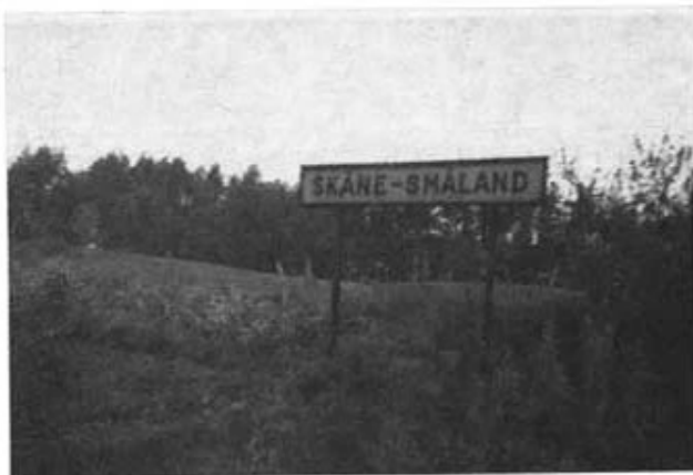
Här gick en gång gränsen mellan Sverige och Danmark.