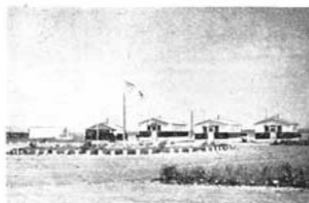
3. kompaniets förläggning. Till vänster den s. k. ADL-teatern, på vars scen underhållningsparallerna uppträdde.

Bataljonen höll sig med en särskild idrottsoffi-