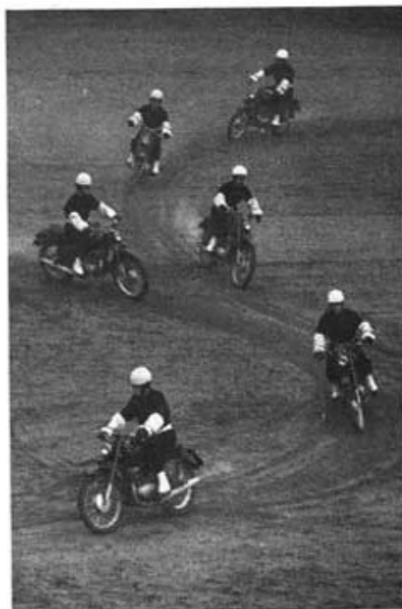
Trafikplutonen vid en uppträning på Regementets dag.

Typexempelövningar har plutonerna till största delen gått igenom tillsammans, detta för att dessa två nära besläktade plutoner i verkligheten ju