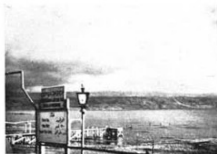
Vid kanten av Döda Havet.