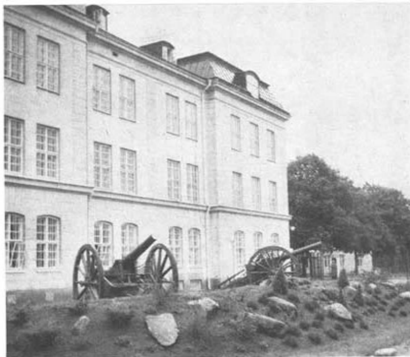
REGEMENTETS NYA ANSIKTE

mot Hållingsborgstegen och Tröngönan. Så här prydligt ser sig "bakgården" av kasern von Heidelema sedan nu allt planeringsarbete är klart.