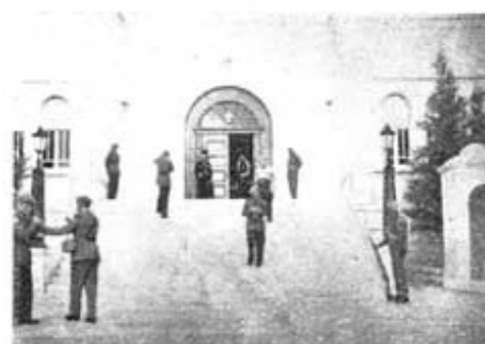
Utanför kung Husseins palats.

För att fortsätta med fotbollen vill jag ej undanhålla läsarna det faktum, att vi efter bataljonsmästerskapen startade i en s. k. skandinavisk cup, där redan i första omgången samtliga deltagande danska och norska lag blev utslagna, varefter slutställningen blev nästan identisk lik tabellen från bataljonens interna uppgörelse. Dessa matcher spelades på en relativt bra grusplan alldeles intill en kompaniförläggning tillhörande Danor — den dansk-norska bataljonen. Annars var fotbollsplanerna i ganska dåligt skick. På Gaza flygfält fick man i brist på bättre förr spela fotboll. Men det berättas, att en gång skulle ett flygplan landa just medan en spännande match pågick, och