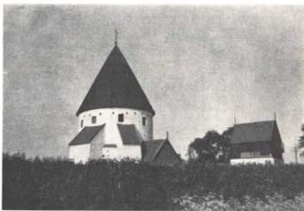
En av fästningskyrkorna, Olst kyrka.

Tydligt är, att förbindelsen och förtroendet mellan kommandanten, den högadlige Holger Rosencrantz, och hans underställda lämnade en del övrigt att önska. De nyssnämnda cheferna i Nexö uppträdde förrädiskt och de "västra kaptenerna" helt passivt. Kanske hade mycket gått anordnande, om ledningen varit inspirerande. Det svenska krigsfolket synes ej ha varit av god kvalitet: " — — — Eftersom de vid plundringen fört en massa öl och vin samman på ett ställe, drack de sig fulla och låg strödda i gator och präng, druckna och vanmäktiga." Wrangel var rasande och rusade själv runt för att återställa ordningen, hotade och slog. Företaget artade sig till finsko. Men då tog plötsligt den nyckfulla Lyckan emot honom på ett oanat sätt! De "västra kaptenerna" ansåg motstånd gagnslöst och anhöll ödmjukt om vapenstillstånd, i det man även erbjöd tiotusen riksdaler i brandskatt. Wrangel, vars avsikt tycks ha varit en lokal demonstration mot Nexö, som en gång kapat ett skepp för honom, såg plötsligt hela "landet" ligga som en present framför sig! Han dröjde ej att