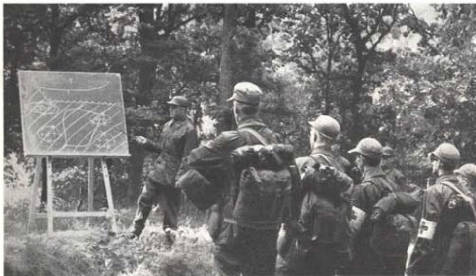
Undervisning i naturen. 1. plutonen 7. kompaniet.