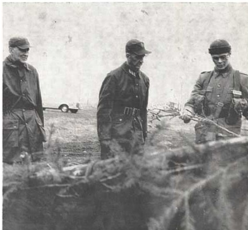
Militärbefälhavaren, generalmajor Stig Olin, vid sin inspektion av regementet 2/12 1963. På bilden följer generalen en övning i skydd mot ABC-stridsmedel.

Nybyggnader - Reparationer Kostnadsförslag - Värderingar