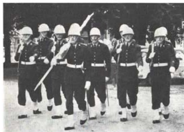
Fansakten vid regementets dag