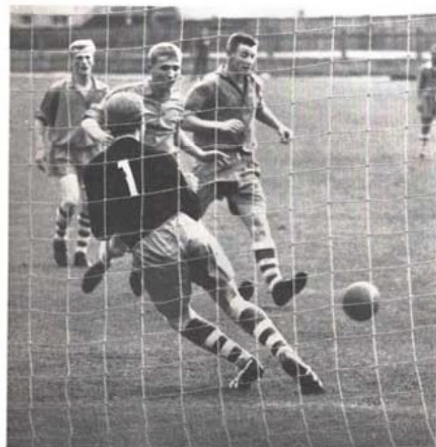
Reg M i fotboll 1963. 7. kompaniets målvakt släpper in en av de sex fullträffarna.