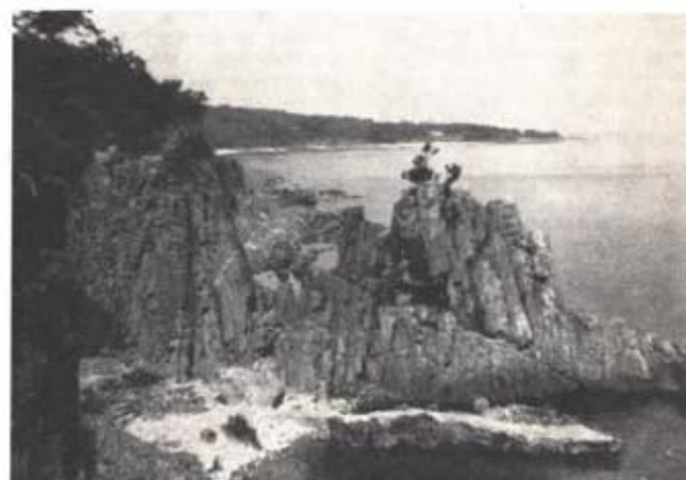
Mörkt botande kan de branta stränderna förefalla.

branta klippkuster. Landet liknar en borg. Det är som sig bör, att den västra kusten krönes av själva Borgen, det väldiga Hamnerhus, som t o m i ruinens tillstånd verkar imponerande. Det krigiska intrycket förstärks av flera andra gamla befästningar, även i det inre, och av de fyra runda fästningskyrkorna — något för detta "land" unikt.