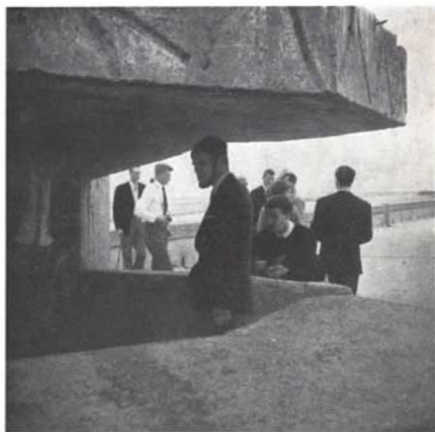
Några av deltagarna vid en tysk bunker i atlantkusten.

Under de återstående dagarna i Paris besöktes bl a Louvren med dess berömda Mona Lisa, Eiffeltor-