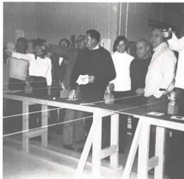
T 4 pistolskytteklubb's pigga medlemmar skuter luftpistol i sin hall.