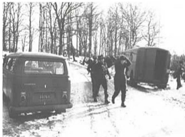
MP-plutonen i aktion.

Att lösa trafiktjänst och även MP-tjänst är arbetsamt för plutonen. Det är dock en mycket omväxlande och intressant tjänst. Mycket av arbetet sker självständigt och med god plats för egna initiativ, varför vi tror, att vi kan säga, att alla finner det stimulerande och värdefullt. Vårt motto är givetvis: MP-tjänsten till Skånska trängregementet.