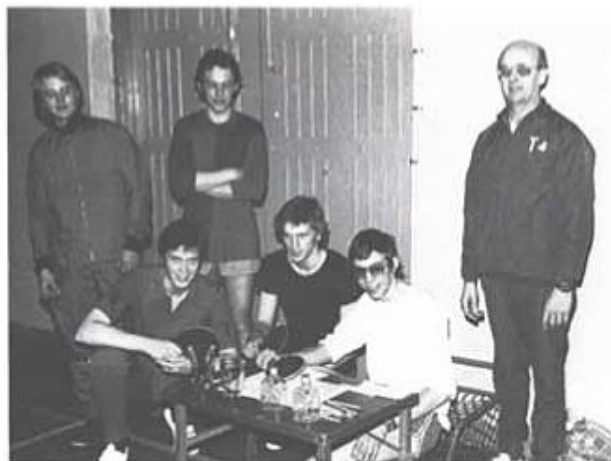
Regementsmästarna i bordtennis tillsammans med tävlingsledaren.

som omfattade fri orientering 10 km, punktorientering och skjutning med gevär. Särskilt väl lyckades han med skjutningen, trots att skjutning med gevär inte utgör hans favoritsport. Kamratföreningen gratulerar till segern.