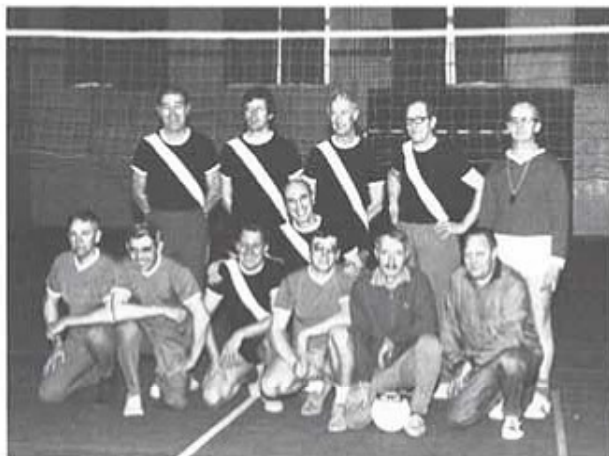
"The T 4-wings" och volleybollslaget från värnpliktskontor Syd.

tat har nåtts. Klubben har under året även deltagit i av Sportskytteförbundet anordnade seriesystem i Int Finpist. Tävlingsutbyte har skett med Tyringe pk avseende 7 tävlingar "int finpist" där T 4 psk hade otur. Tränings tävlingar i fältskjutning har som vanligt skett mellan T 4 psk - Tyringe pk - Sösdala pk och P 2 skf omfattande fem tävlingar. Klubben har under året varit värd för kretsens damtävling samt för en krets-fältskjutning och en krets-fältskjutning. Medlemmarna har under året i en ökad omfattning re-