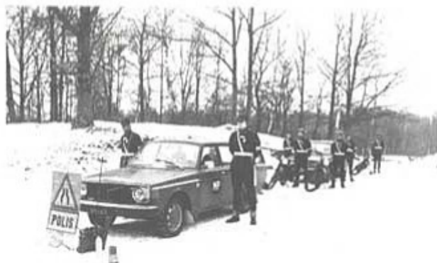
MP-plutonen uppställd vid fordonen.

Hand i hand med MP-försöken går i år den gruppinriktade utbildningen. För vår pluton har det varit mycket positivt, där bl a den ständiga grupporganisationen i hög grad bidragit till en mycket god anda inom plutonen. En stående or-