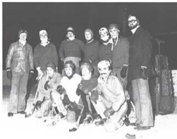
Ett av T 4:s korplag i ishockey.