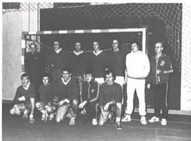
T 4:s handbollslag

T 4 Pistolskytteklubb har haft årsmöte för fjärde gången i egen regi. Året har präglats av ett digert tävlingsprogram där klubben deltagit både individuellt och i lag i av Svenska Pistolskytteförbundet och Svenska Sportskytteförbundet anordnade tävlingar. Klubbens eget tävlingsprogram har omfattat 31 tävlingar. En omfattande verksamhet på luftpistolssidan har ägt rum under våren och hösten. Klubben deltar med lag i luftpistol-allsvenskan där framstående resul-