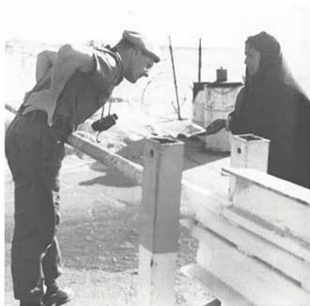
Identitetskontroll vid Check Point.

Från Sverige tillförs bataljonen förnödenheter via regelbundna flygtransporter varannan vecka till BEN GURION AIRPORT utanför TEL AVIV. Livsmedel hämtas i ISMAILIA hos den canadensiska servicebataljonen (CANLOG). Färska grönsaker, frukt och vissa baslivsmedel såsom mjölk, inköps direkt "i orten" d v s i Israel. Detta ställer krav på väl fungerande kyl- och frystransporter. Lågoktanig bensin tillföres av det polska förbandet (POLIOG) från egyptiska leverantörer.