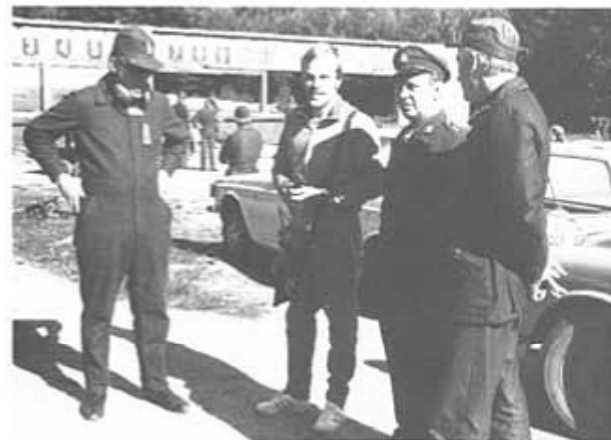
Tävlingsresultaten diskuteras av några plutonofficerare.

GÅ EJ ÖVER BRON för att klippas! GÅ TILL ODDS