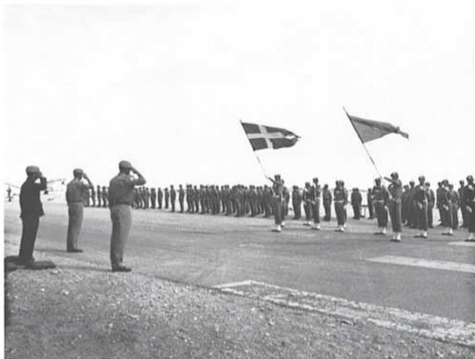
Medaljparaden före bataljonens återresa till Sverige.