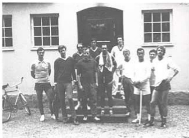
Regoff- och plutofflagen efter sin match.

Efter tävlingen samlades man i regementsofficersmässen för ett en-