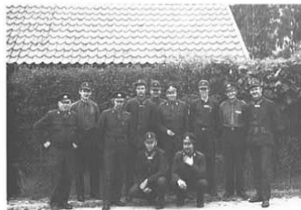
Pistolskyttarna, mer eller mindre framgångsrika.