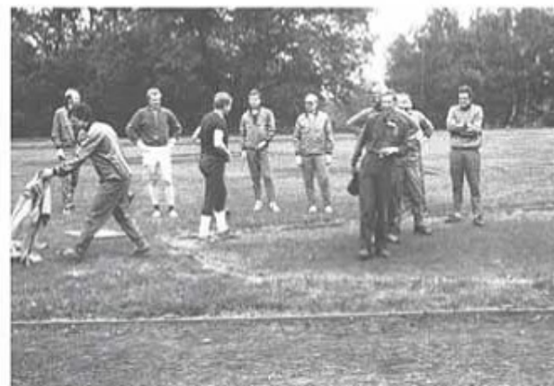
Uppvärmning före cykeltävlingen.