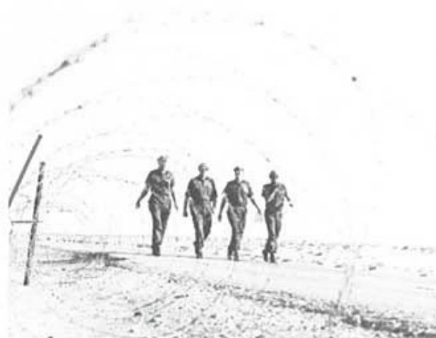
Bataljonschefen med medarbetare på inspektion.

Den svenska bataljonen består av ca 670 man, fördelade på tre skyttekompanier om vardera 156 man, ett