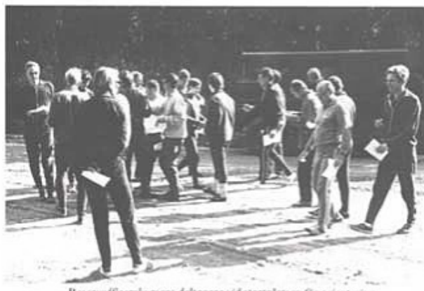
Reservofficerskursens deltagare vid startplatsen för orientering.