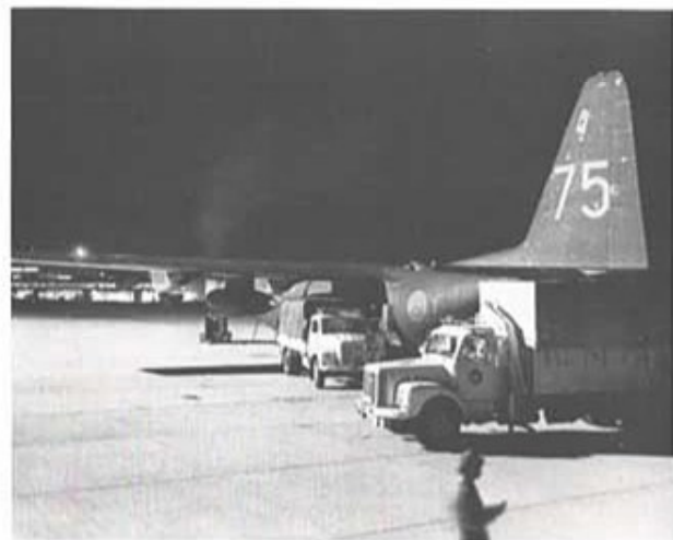
Omlastning från svenska Flygvapnets C 130 (Herkules) till transportpluton på Ben Gurions flygplats.