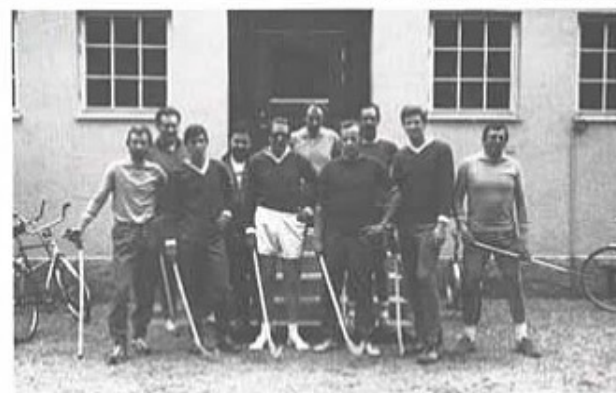
Regoff- och kompoßflagen efter match i rinkbandy.