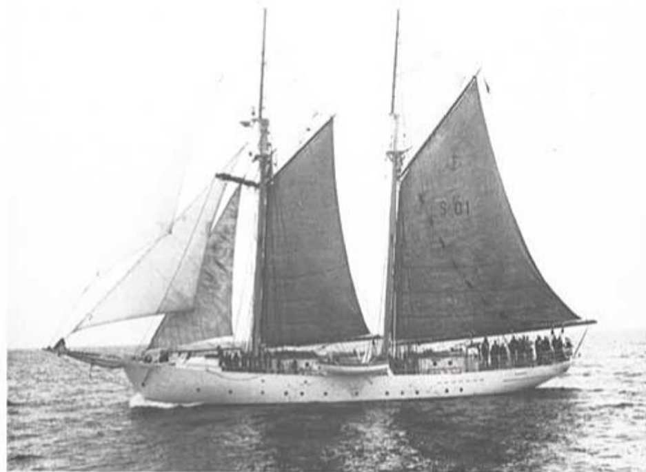
Skolskeppet Gladan i all sin prakt.

Fältlunch intogs i Backåkras trädgård innan rundturen i Österlen