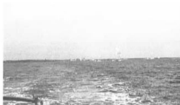
Falken för fulla segel mot Ystads redd.

Bliv medlem i regementets Kamratförening