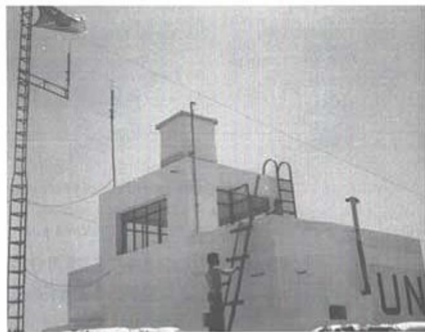
Observationspost OP LAB på gränsen mellan Libanon och Israel

Så meddelar OP RAS att de är under eld och har tvingats ned i skyddsrummet. Därefter bryts radioförbindelsen. Granatkastarna som nu varit tysta en stund återupptar skjutandet, denna gång mot den gamla tullstationen i Naqoura där FN har fem observatörer och två civila. Efter en stund meddelar även de att de befinner sig i skyddsrummet och för tillfället befinner sig väl. Beirut ropar på OP RAS. Inget svar. Även OP KHIAM, den östligaste OP'n, meddelar att de befinner sig i skyddsrummet. Vi ombeds att försöka få kontakt med OP RAS. Fortfarande ingenting! Granatkastarelden mot Naqoura upphör. Vi har räknat till 90 granater. Istället hör vi stridsvagnseld och från vår upphöjda plats kan vi se spårlysen från 10,5 cm-granaterna.