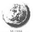
M/1894. (Silver, Brons.) Skånska trängkåren.