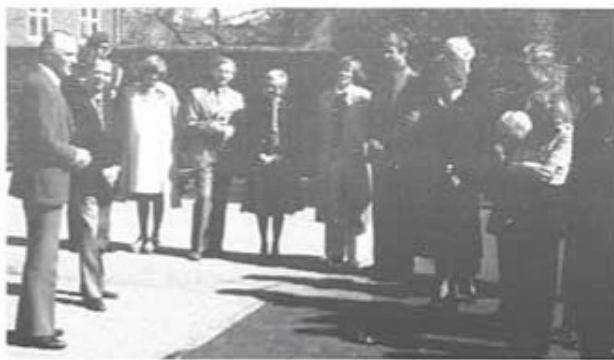
Deltagarna samlade inför avresan till Köpenhamn.