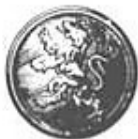
M/1891. (Silver, Brons.) Göta trängkår.