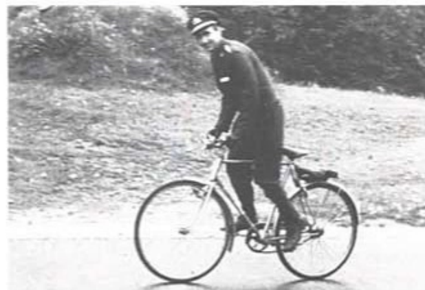
En spänstig överste...