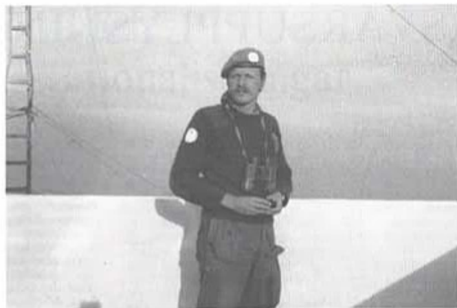
Artikelförfattaren vid ovannämnda observationspost

Så hör vi handeldvapeneld. Tydligt stormar israelerna Naqoura. Vi anropar Naqoura, men får inget svar. Artillerield och flyganfall pågår fortfarande.