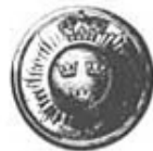
Från år 1915 gemensam knapp för trängtrupp- perna

T 4 nya vapen utgör omslagsbild i detta nummer av Snapphanen.