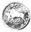
M/1893. (Silver, Brons.) Norrlands trängkår.