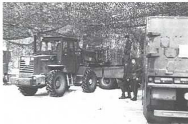
Ammunitionsplutonen under föreläsning av hantering av ammunition.