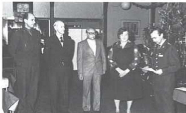
Regementschefen avtackar personal som avgått med ålderspension eller flyttat från garnisonen och som tillhört regementet, tjänstgjort vid regementet (officiellt tillhörande P 2) eller samverkat med regementet.