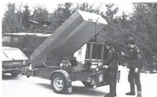
Trafikplutonen föreläsade om den nya släp, som numera ingår i plutonens organisation.

Den 26.-03-05 genomförde kursen A-104 vinterutbildning i Sollefteå.