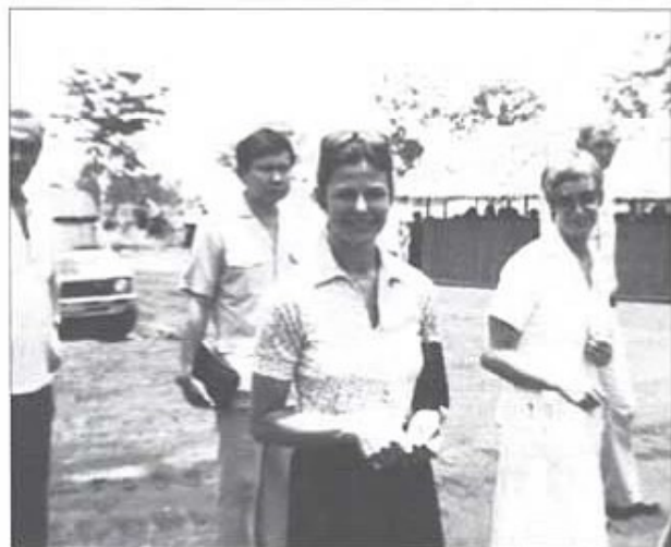
Drottning Silvia under konungens och drottningens besök i samband med hemresan från statsbesöket i Japan.

Svara för enhetens verksamhet när chefen ej är tillgänglig, med andra ord stimulerande arbetsuppgifter.