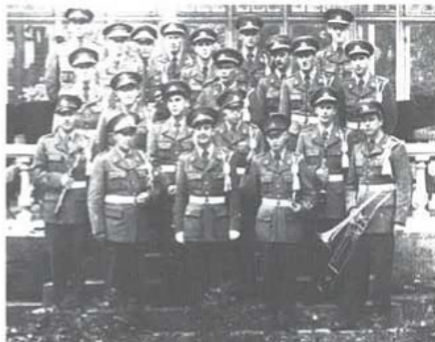
T 4 musikkår vid sitt sista framträdande vid Regementets Dag 1956-09-09.

Musikkåren hade ett flertal engagement utanför Hässleholm, bl a i Malmö, Ronneby, Varberg, Halmstad och Göteborg.