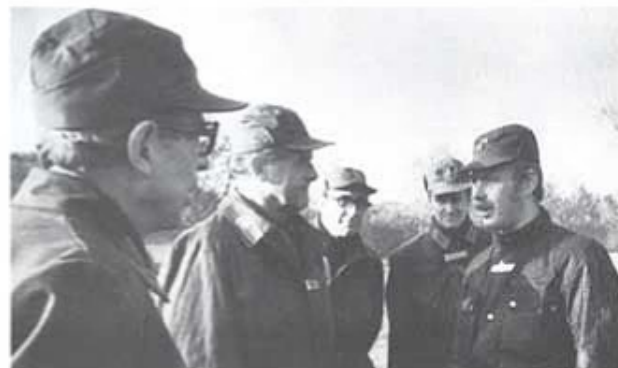
Bild från tränginspektörens inspektion av grundutbildningsbataljonen 1981-10-21.

Den 10. var det inryckning av F- och G-värnpliktiga samt omgång 2 av årets handräckningsvärnpliktiga. Cirka 300 värnpliktiga ryckte in.