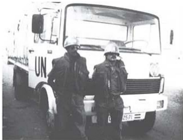
Artikelförfattaren på väg till Beirut i Libanon med konvojen från SWED-MEDCOY.

I södra Libanon är ca 6000 FN-soldater från olika nationer grupperade. De kommer bl a ifrån Senegal-senbatt, Fidjiöarna-fijibatt, Holland-dutchbatt, Nigeria-nibatt, Ghana-ghanbatt, Irland-irishbatt, Nepal-nepbatt, Norge-norbatt, Frankrike-frenchlog (underhållsbatt), Italien-italair, Sverige-SWEDMEDCOY.