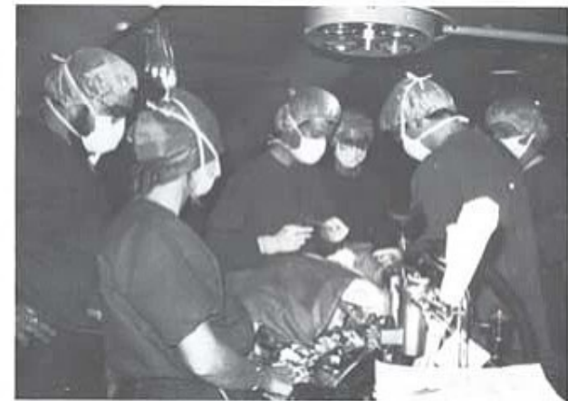
Det var inte någon dramatik kring utgången. På operationsbordet låg sårmarkörer.

Utrustningen kan mäta sej med länsjukhuset i Kristianstad, och vid jämförelsen med ett amerikanskt Natosjukhus ligger det svenska rent av före. Sydfronts 24 000 soldater kan känna sej säkra ifall något skulle hända dem. En personal på 390 personer står redo i sina olika funktioner. Sjutton lä-