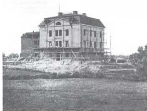
Kanslihuset under fullbordande. I bakgrunden syns stora kasernen (nuvarande kasernen von Heideman).