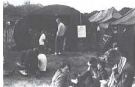
Svenska sjukvårdstället i lägret, omplåstring och väntan. Få svenskar bröt, dock totalt mer än 2500 deltagare, främst beroende på värmen.