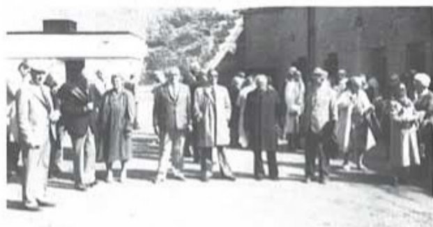
Deltagarna samlade på planen framför museet efter att ha besökt det förnåma museet.

En femhörning bastionsfästning skulle anläggas på Bäckholmen, den östra av de båda holmarna i sundet, medan på Dynan, den västra av holmarna, skulle uppföras "en stark donjon eller förhöjt batteri av 60 grova stycken, försedd med fyra bastioner". Bäckholmen blev Kungsholmen och Dynan Drottningsskär. Det praktiska arbetet och ledningen uppdrogs åt Stuart. Vid "första vårdag", 1680, skulle befästningsarbetena påbörjas.