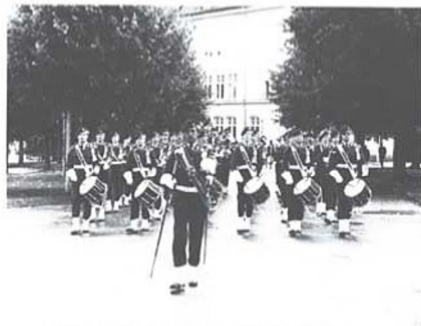
Arméns musikpluton före sitt framträdande på kaserngården.