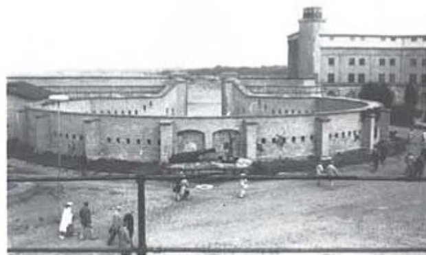
Bilder från besöket på Kungsholmsfort.