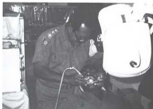
Fidjiöarnas tandläkare behandlar en av soldaterna, som skall återvända till Fidjiöarna.

Vi passerade PLO:s område och vid den checkpointen var soldaten (ja han var egentligen civilklädd) lite vrång. Lastbilen framför oss var lastad med lådor från Seacypen och PLO:aren ville titta i dessa men det ville inte föraren. PLO:aren viftade lite demonstrativt med