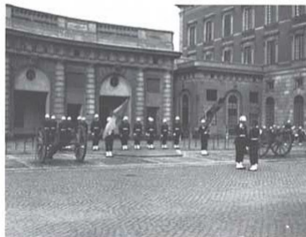
T4 högvakt vid Stockholms slott. Vaktavlösning.

Den 31. var det inryckning av värnpliktiga ur militärområdets armeförband, som fram till utryckningen 10-22 skall lära sig att kunna ingå i förbandsplatsgrupp, som upprättar bataljonsförbandsplats. Hur den nya utbildningen går till har redovisats i Snapphanens höstnummer 1980.