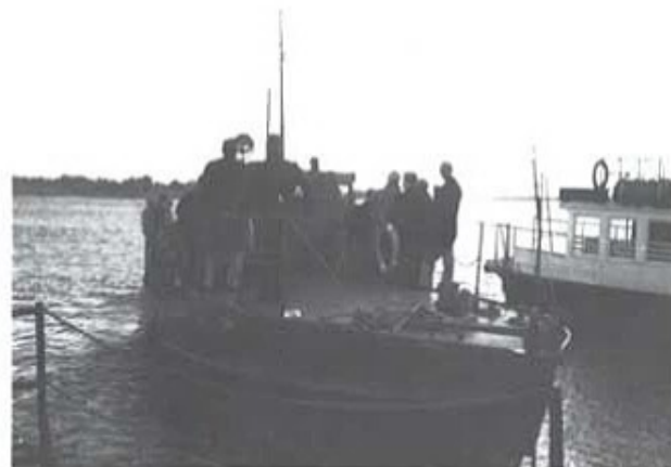
Överfarten från fastlandet till Kungsholmsfort skedde med slupen Djäv.

Landskapet har kunnat glädja sig åt Nordens första renässansstad då Kristian IV mellan åren 1624-1634 lät uppföra Kristianopol på den lilla staden Avuskärs öppet på den danske kungens stora intresse. Karl XI grundade Karlskrona för 302 år sedan och som byggnadsmaterial togs den huggna stenen bl a från de raserade vallarna i Kristianstad och Helsingborg. Således fick Kristian IV ofrivilligt bidraga med sten.