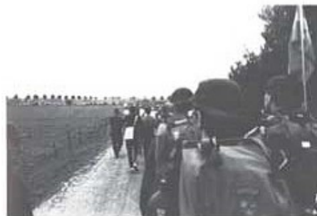
På marsch i Holland, oändliga tusenfotade kolonner så långt ögat når.