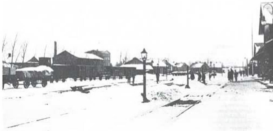
Tjessleholms järnvägsstation i Snö.