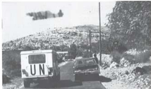
Inspektion av de olika bataljonerna i "area of operations".

Efter en måltid i deras mäss var det dags att åka hemåt så vi var säkra på att komma igenom Sixten (Hatats) checkpoint. De stänger