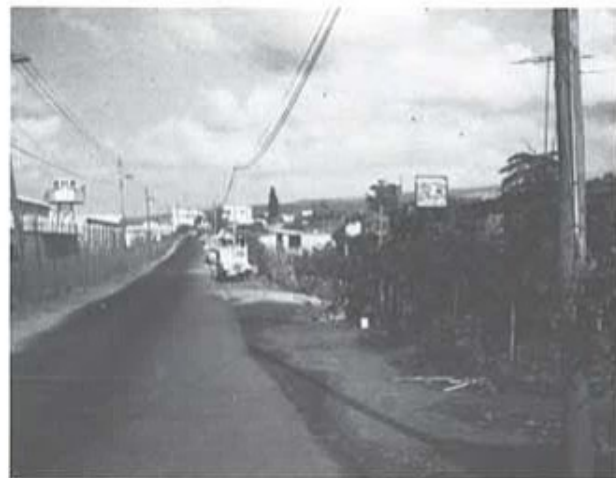
Huvudgatan "Jallastreet", som går omedelbart utanför Camp Silvia. Omtyckt promenadplats på kvällarna fram till klockan 2100, då gatan blir tom, eftersom all FN-personal då skall vara inne i campen.

13/10. Revelj 0500. Jag gick och åt frukost. Det blev ingen fransk konvoj utan TPC hade tre bilar som skulle gå upp och det räckte. När vi hade kört i fem km började det ryka från VW-bussen. Den fick vända och byta till en annan bil medan vi väntade utmed vägen. Medan vi väntade i Hadads land passerade den franska konvojen som jag egentligen skulle åkt med. Den var tungt beväpnad med pansarbilar medan vi bara hade vår väst, hjälm och pistol. Vi fortsatte