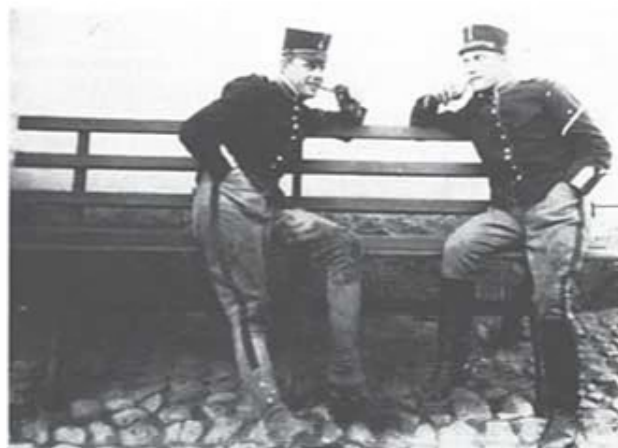
Rökpaus utanför stallet. Fotot taget år 1925 (?)

Näja, alla äro vi barn i början och bör lära av de äldre och de som mera vet. Huruvida hästen och