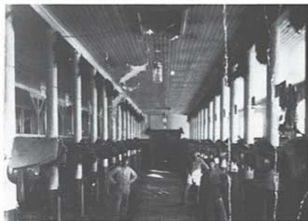
Interiör från stallet, omkring mitten av 1920-talet.

Sedan plutonen avlämnats till stallunderofficeren blev det marsch på ett led förbi lådan med ryktbon. Det var en god utsiktspunkt för att se deltagarnas olika reaktioner, det var alltid någon som kanske aldrig varit i närheten av en häst, så man kan förstå attityden som peka på "Sålt smöret, men tappat pengan". När var man tilldelats en häst, löd kommandot "Rykta höger sida" och för någon kändes det nog som språnget ut i det okända, när han gav sig in på kusens privata område. De flesta av stallens inackorderingar uppförde sig korrekt, men