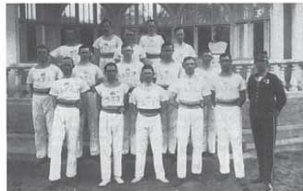
T 4 gymnastiktrupp omkring 1920.