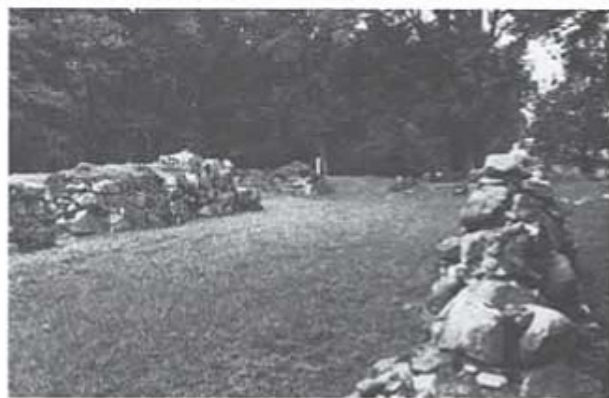
Ruinerna av Mölleröds slott.