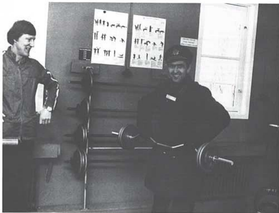
Regementschefen och chefen för idrottsavdelningen i samband med "invigningen" av styrketräningslokalen efter en omfattande renovering.