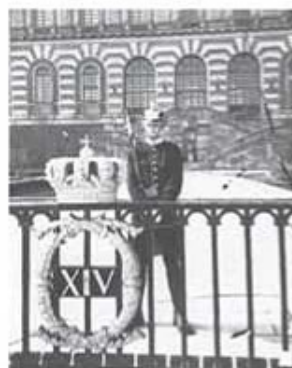
På post på lejontrappan vid Stockholms slott en trängsoldat modell 1885 med anledning av 100 års jubileet av trängtrupperna.

pliktiga och befäl ur T 4 grundutbildningsbataljon skötte sig väl och tog hem en andraplacering i de tävlingar som Arméns underhållsskola, (US), arrangerade, för lag ur alla fyra trängregementena.