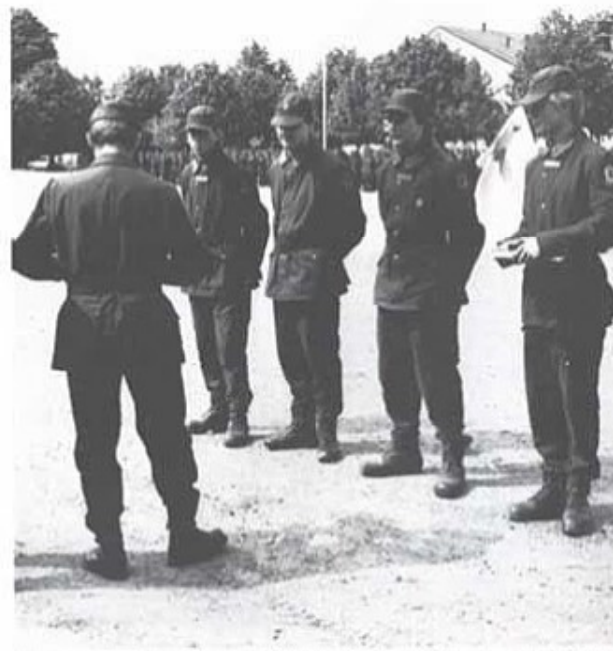
Regementschefen överlämnar diplom och boken "Tränggrupperna 100 år" till kompaniernas Främste Soldat (många var förhindrade att delta).

Den 30. avtackade regementschefen årsklass 1984/85, som den 31. hade utryckning från sin grundutbildning vid regementet.