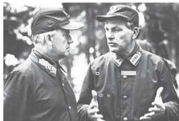
Chefen för armén och tränginspektören under samtal vid inspektionen av T 4.

Inspektionen fortsatte sedan med att CA följde utbildningen vid grundutbildningsbataljonen på förmiddagen under det att hans med-