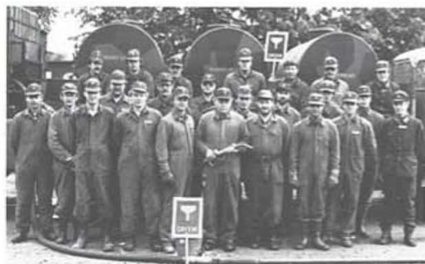
Deltagarna vid drivmedelskursen vid T 4 i juni 1985.