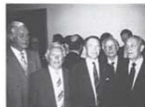
T 4 kamratförening var väl representerad vid kamratmiddagen i Karlbergs slott.