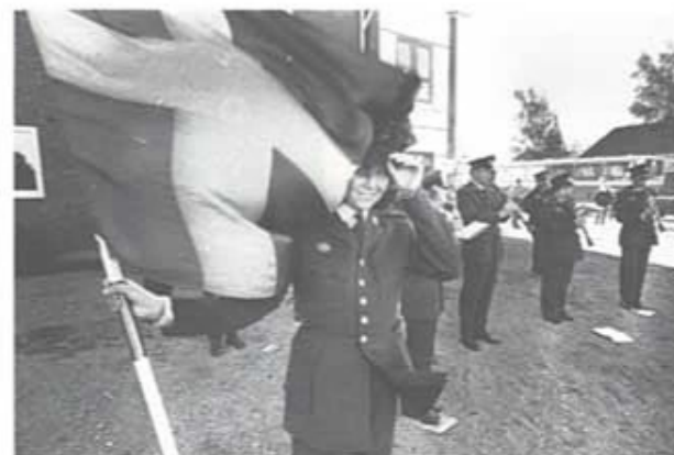
Hemvärnsmusikkåren från Billesholm spelade friska sprittande toner vid samlingsplatsen i Kägeröd den 28. september. Även vinden friskade i!

De anhöriga var inte sena att följa uppmärksammningen att utnyttja fältposten vid samlingsplatsen i Kägeröd i samband med besöksdagen. Bataljonens ca 700 man fick i snitt 200 brev om da- gen under hela F-skedet!