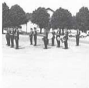
I samband med regementschefens avtäckning av årsklass 1984/85 1985-05-30 genomförde Regionmusikavdelningen i Kristianstad sin sista spelning vid T 4 med ceremoniel musik.