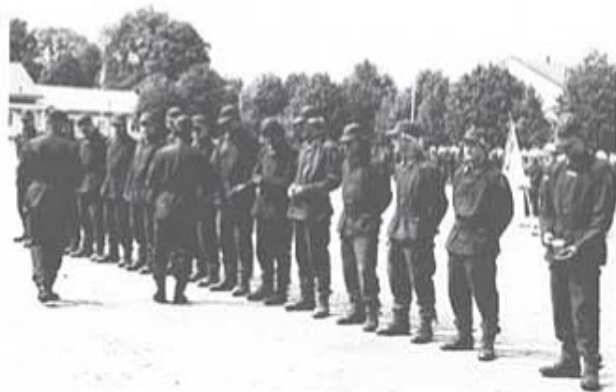
Regementschefen överlämnar priser till segrande kompani - 3, kompaniet, i Regementsmästerskap i fotboll.