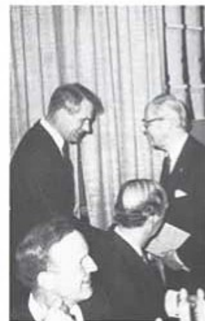
Även före generalmajoren Birger Hasselrot talade och tackades av tränginspektören översten Curt Sjöo.