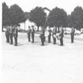
I samband med regementschefens avtäckning av årsklass 1984/85 1985-05-30 genomförde Regionmusikavdelningen i Kristianstad sin sista spelning vid T 4 med ceremoniel musik.