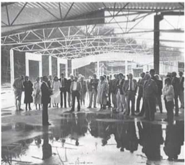
T4 nya skolhus träng, som är under byggnad, besöktes.