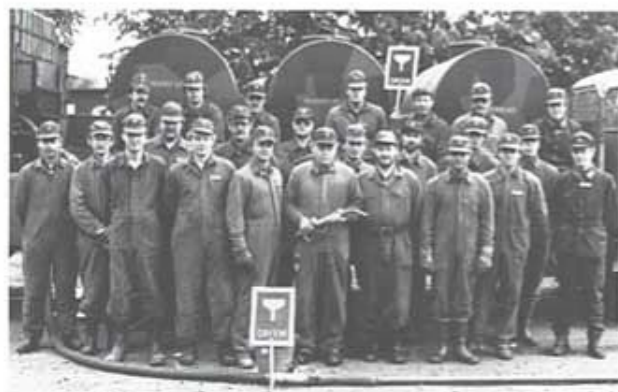
Deltagarna vid drivmedelskursen vid T 4 i juni 1985.