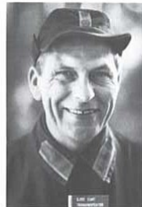
En nöjd och belåten tränginspektör, överste 1. gr Curt Sjöo. (Bilden tagen av Thor Balkhed under KFO 1985).

nungen, överbefälhavaren och chefen för armén till alla och en var som bidragit till framgångarna.