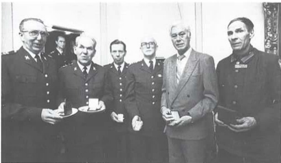
Avtäckning av anställd personal 1986-03-27