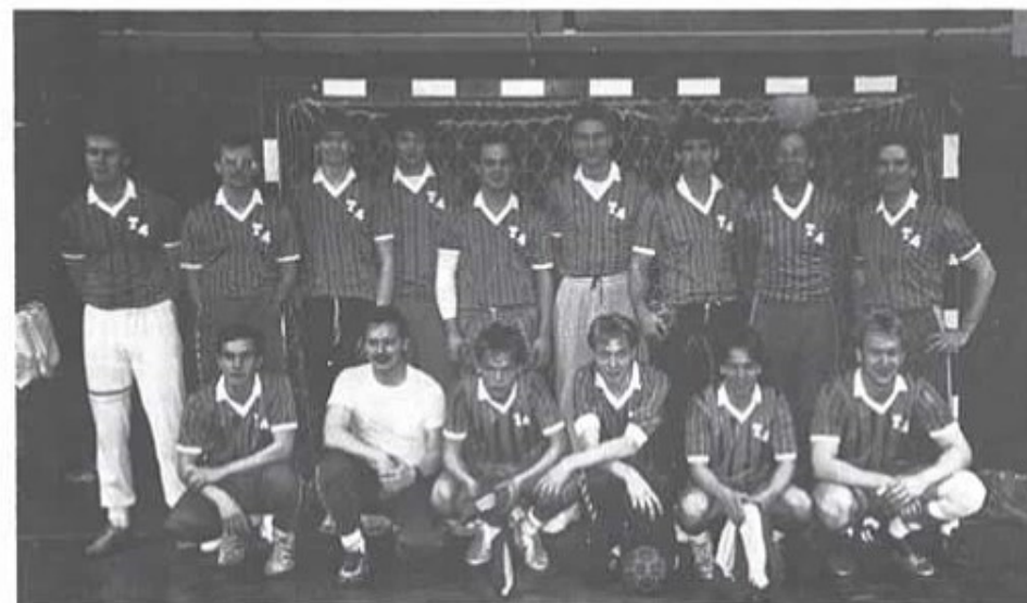
T 4 Regementslag i handboll 1985/86.

I Milo-cupen i handboll är både P 2 och T 4 på väg till semifinal. Kanske med lite tur blir det ett returmöte för garnisonens handbollslag, men då i ett finalmöte i Milocupen.