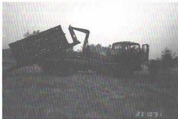
Engelsmännens nya lastväxlarfordon, här lastat med MLRS-ammunition. Prövades första gången operativt under Desert storm.

Resten av eftermiddagen fortsatte vi runt och tittade på signal- och vapenreparationer. Fick chansen att utbyta information med både soldater och befäl. När man