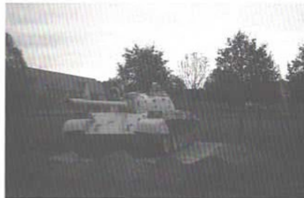
Krigsbyte från Gulfen , irakisk T55.

Något som naturligtvis etsar sig fast i minnet är, när man själv får göra någonting, som att åka warrior och challenger. Men även att