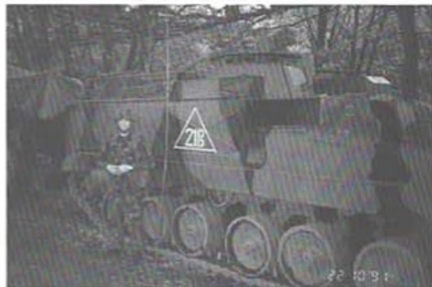
Skrubbenen prövar engelsmännens eldhandvapen vid gruppetad Armoured Infantry. Day III.