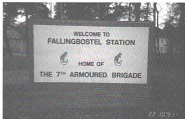
Garnisonsskylt vid infarten till Fallingbostel .