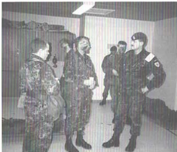
Allt befäl i befattning är sminkade under hela övningen. Här ses chefen för sjukvårdskompaniet med kaffemuggen i handen.

meter mellan "delingarna" (=pluton). Bataljonsstab och stabskompaniet leder verksamheten från stabsöverreden (=puhbatstaben). Huvudsambandsmedlet är radio i