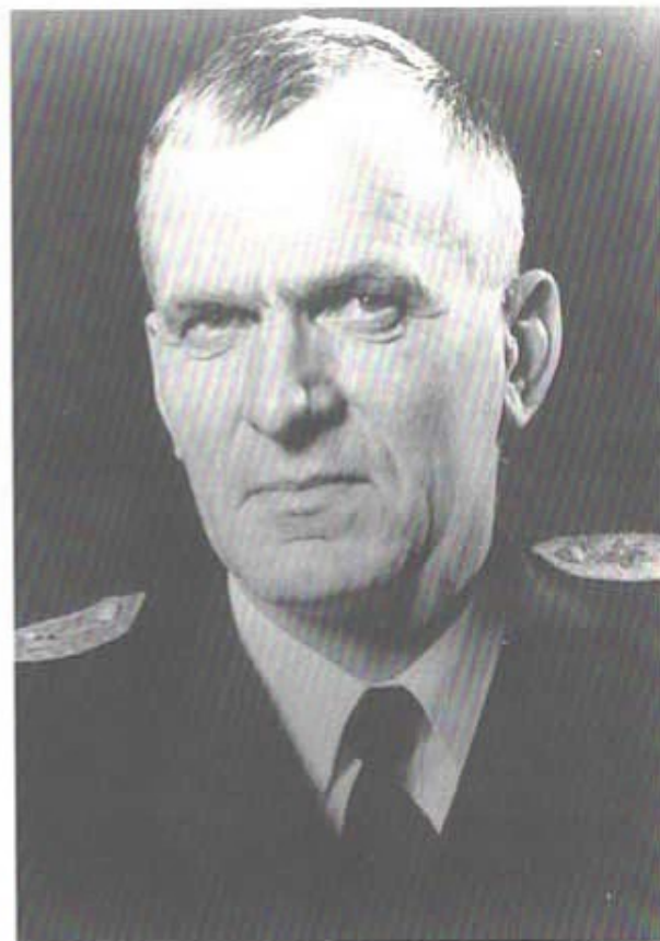
Generallöjtnanten Owe Wiktorin