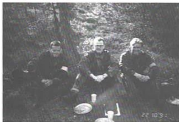
Skrubbenen själv mellan två soldater vid förevisning av sjukvårdsenhet under dag III.