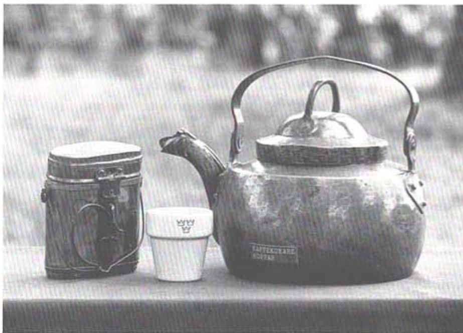
Kökkärl, kopp och kaffekanna var lika nödvändiga attribut förr som nu inom det militära.

användes gården som en fritids-gård för soldaterna.