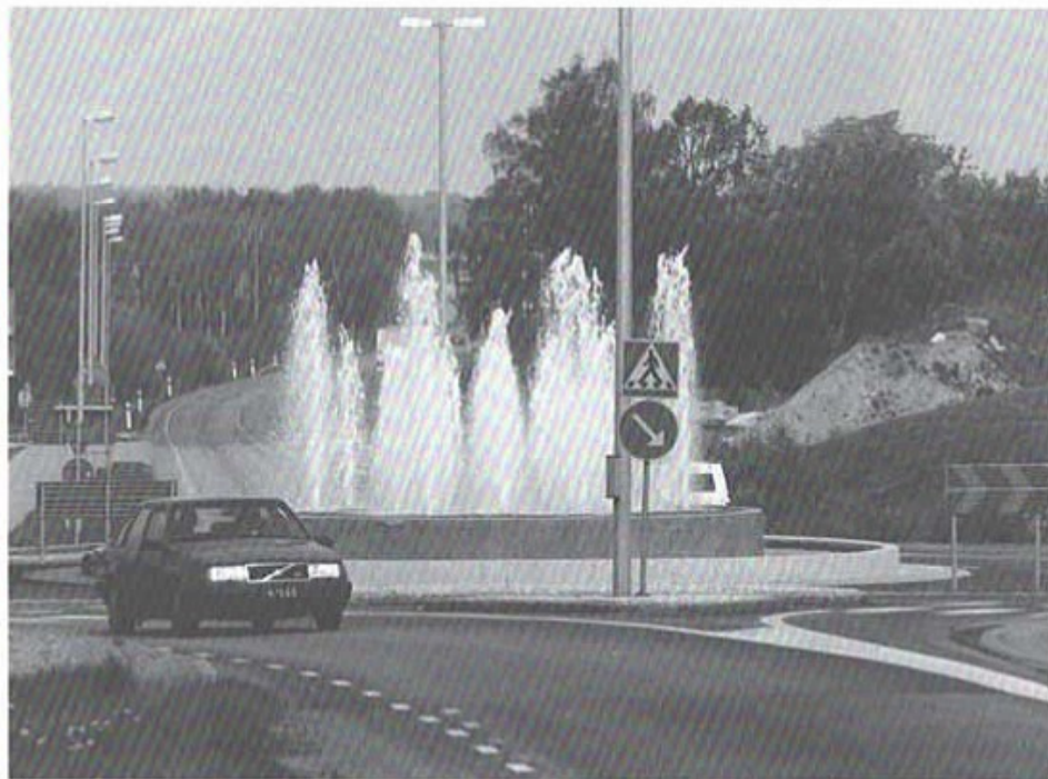
Det omdiskuterade ljus och vattenspelet vid T4-rondellen lär nu bli ett permanent inslag i trafikmiljön, trots att kommunens tekniska nämnd endast godkänt vattenspelet under en ettårig försöksperiod. På torsdagen överlämnade Huvu anläggningen till Hässleholms kommun, som en gåva i samband med nyinvi- gningen av T4-området.

För ett år sedan ansökte Huvu om att få bygga ett ljus- och vattenspel i den nya T4-rondellen utmed väg 117. Tekniska nämnden sa nej, ef-