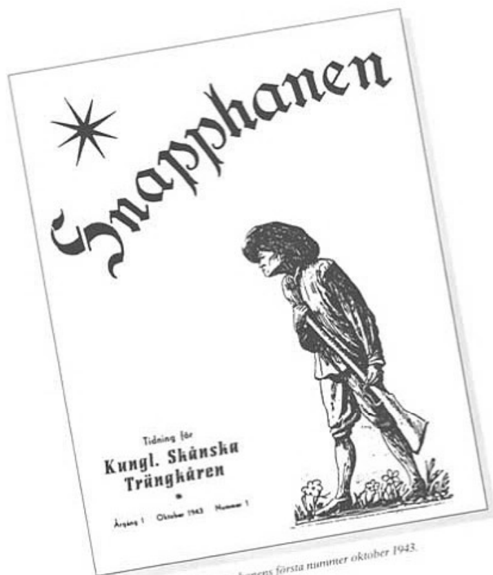
Omslagsbilden till Snapphanens första nummer oktober 1943.