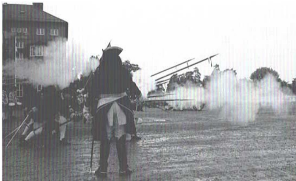
Smålands karoliner under stridsuppvissning.