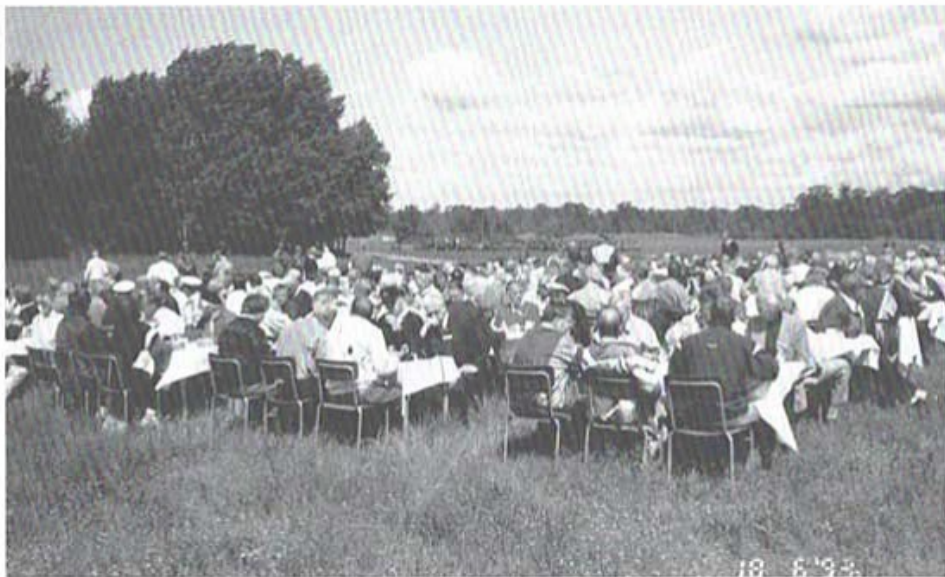
Fäldlunch med konsert.